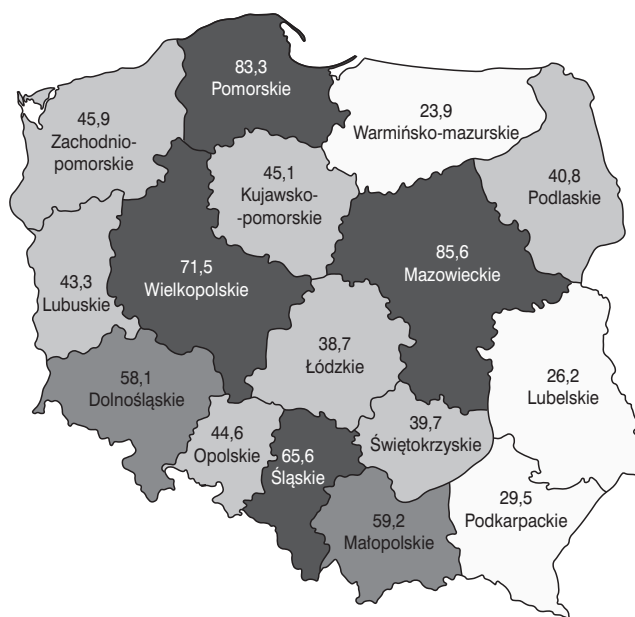
Rys. 2. Poziom syntetycznego wskaźnika rozwoju przedsiębiorczości w Polsce według województw.

W 2010 r. Polska była krajem o największej liczbie nowo powstałych przedsiębiorstw. W całej dekadzie 2003–2012 liczba przedsiębiorstw nowo powstałych była wyższa niż zlikwidowanych (PARP, 2014), co świadczy o dobrych warunkach do podejmowania decyzji o prowadzeniu firm. Przedsiębiorstwa, które uczestniczyły w badaniach, powstały w tym korzystnym dla polskiej przedsiębiorczości okresie. Badane przedsiębiorstwa prowadzą działalność w Wielkopolsce, w regionie, który od lat utrzymuje się z czołwce krajowej województw pod względem syntetycznego wskaźnika rozwoju przedsiębiorczości. Wskaźnik ten zbudowano na podstawie 26 zmiennych dotyczących liczebności przedsiębiorstw, liczby osób pracujących, wielkości przychodów, kosztów i nakładów inwestycyjnych (PARP, 2014). Poziom wskaźnika przedstawiono na rysunku 2.