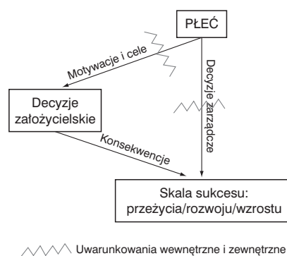
Rys. 1. Wpływ płci na działania przedsiębiorcze.

Na podstawie dotychczasowych rozważań zaproponowano model badawczy wskazujący na dużą rolę uwarunkowań wewnętrznych i zewnętrznych, które wpływają zarówno na motywacje oraz cele biznesowe, jak i na funkcjonowanie założonych przez kobiety firm (rysunek 1). Model ten wskazuje na wpływ płci, a dokładnie motywacji oraz celów, jakimi kierują się kobiety, na decyzje założycielskie. Zakłada się, że motywacje oraz cele powodują, że otwierane przez kobiety firmy są mniejsze, a wartość zaangażowanego kapitału niższa. Ponadto, jak wynika z analiz, kobiety prowadzą działalność w sektorach nisko kapitałowych (usługi socjalne, zdrowotne, edukacyjne), co jednak powoduje także niższą stopę zysku (European Commission, 2014), czyli są to firmy zlokalizowane w domu, co ogranicza możliwości zwiększania zatrudnienia. To wszystko z kolei determinuje dalsze funkcjonowanie tych firm. Zarówno motywacje, jak i cele są kształtowane przez uwarunkowania wewnętrzne oraz zewnętrzne, o czym już wspomniano. W modelu uwzględniono także wpływ płci na skalę sukcesu (nie analizowano, czym ten sukces ma się przejawiać – stopą przeżycia, rozwoju tudzież wzrostu), przy czym – podobnie jak w przypadku decyzji założycielskich – zakłada się, że decyzje zarządcze są także kształtowane w dużym stopniu przez uwarunkowania wewnętrzne i zewnętrzne.