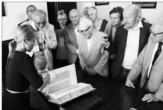
Po zakończeniu obrad uczestnicy konferencji mieli możliwość obejrzenia starodruków ze zbiorów TNP.