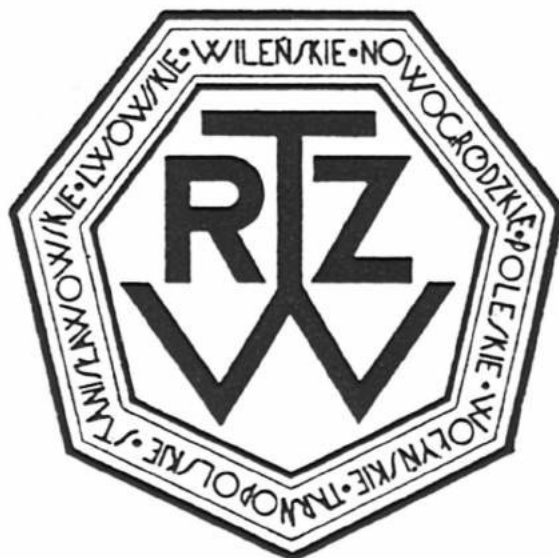
Logo Towarzystwa Rozwoju Ziem Wschodnich

Obszar działania okręgu warszawskiego początkowo wykraczał poza teren województwa, z czasem