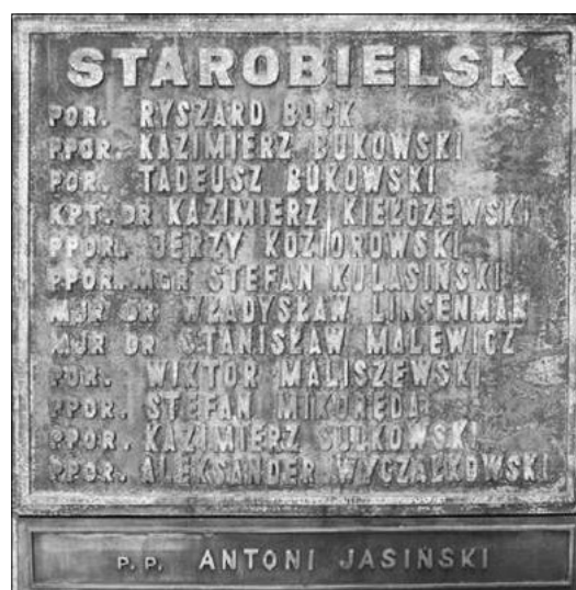
Tablica na Pomniku Ofiar Katynia w Sierpcu poświęcona pomordowanym sierpczanom z obozu w Starobielsku. Na ostatnim miejscu widnieje – słabo widoczny – Aleksander Wyczałkowski.