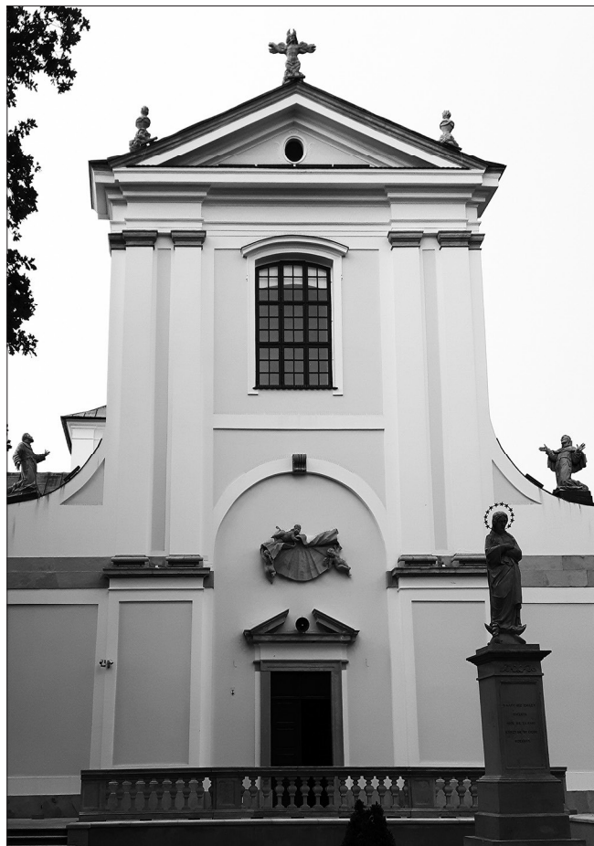
Elewacja frontowa kościoła reformatów w Węgrowie.

Kościół węgrowski jest typowym kościołem reformatów, zachowującym charakterystyczne dla tego zakonu elementy.