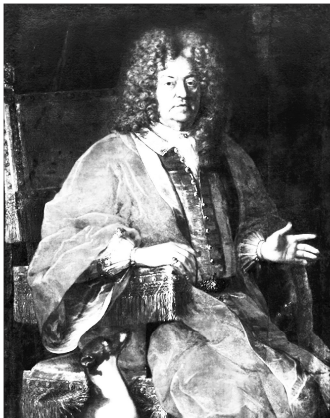
Jan Dobrogost Krasiński, mal. Michelangelo Palloni, ok. 1700