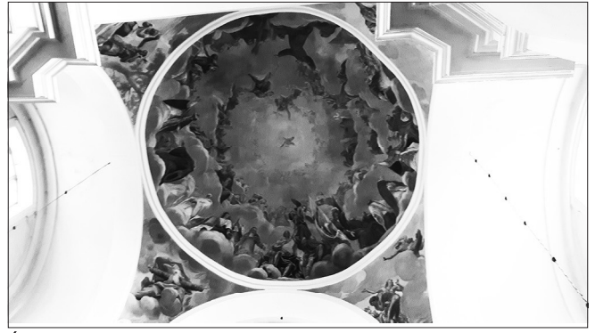
Ślepa kopuła w kościele reformatów w Węgrowie.

filarami, aby od wewnątrz przylegały one do ścian tworząc po bokach ciąg płytkich wnęk lub kaplic (stąd odmiana wnękowa lub kaplicowa) 28 . Kościół węgrowski wzniesiono w odmianie kaplicowej podobnie jak wcześniej kościoły reformatów w Warszawie (1680 r.), Białej Podlaskiej (1684 r.) i później w Miedniewicach (1748 r.) 29 . Ściany nawy są rozczłonkowane parami toskańskich pilastrów 30 . Podwójne pilastry są charakterystycznie nie tylko dla kościołów reformackich, ale w ogóle dla kościołów barokowych. Taki zabieg zastosowano w kościele II Gesu i można go znaleźć w wielu kościołach w Polsce choćby w kościele św. Apostołów Piotra i Pawła w Krakowie (jezuitów) św. Bernardyna ze Sienny w Krakowie (bernardynów). W przypadku reformatów podwójne pilastry występują znacznie częściej w prowincji wielkopolskiej niż małopolskiej. Na skrzyżowaniu nawy z transeptem ślepa kopuła. Kopuła na skrzyżowaniu nawy z transeptem również jest elementem barokowym znanym z kościoła II Gesu. Jednak w Węgrowie zastosowano ślepa kopułę a wynika to z przepisów budowlanych reformatów, które zabraniają kopuły w ich kościołach. Ślepa kopuła jest kopułą widoczną tylko od wewnątrz, w bryle zewnętrznej kościoła jest niewidoczna. Podobny zabieg stosują także karmelici bosy, którym przepisy budowlane również zabraniają kopuły w kościołach 31 .