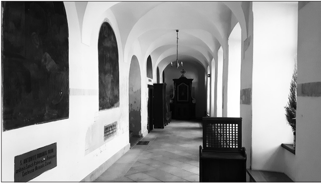
Krużganki w klasztorze reformatów w Węgrowie.