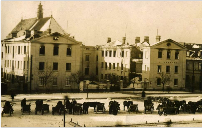
Ruiny budynku Starostwa Powiatowego w Łęczycy. Stan zimą 1939/1940 r.