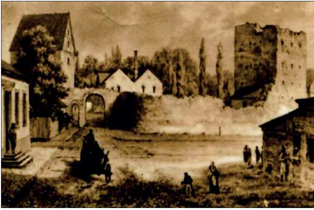
Ruiny zamku w Łęczycy. Stan po wojnach w XVII i XVIII w. Źródło: Muzeum w Łęczycy, sygn. MŁ/H-1480