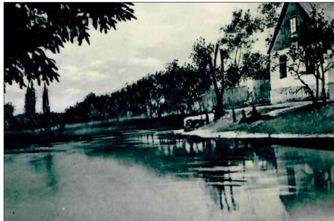
Rzeka Bzura w Łęczycy. Lata 20.-30. XX w.

Niemcy ponownie rozpoczęli bombardowanie miasta, co wzniciło pożary i zniszczyło kolejne budynki. Tymczasem po 3 dniach natarcie polskie na odcinku Stryków-Brzeziny wskutek gęstniejącego