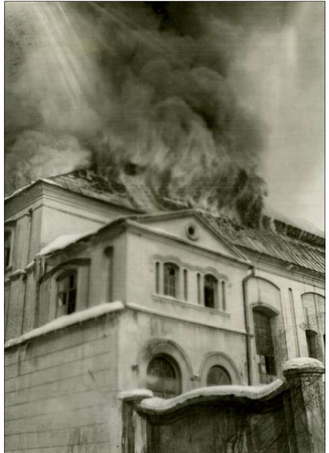
Płonąca synagoga łęczycka, 1940 r.