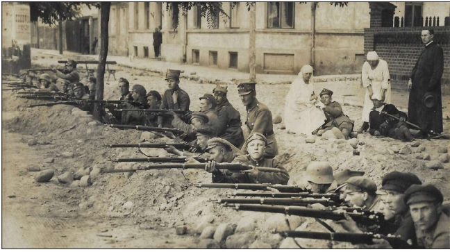
Obróńcy Włocławka w okopach na bulwarze nad Wisłą.

Do wniosku dołączone były dwa świadectwa jego podkomendnych, potwierdzające bohaterskie czyny swego dowódcy. Pchor. Franciszek Karczewski zaś świadczył: