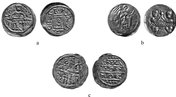
Ryc. 4. Denary Bolesława Kędzierzawego, a: typ 1, b: typ 2, c: typ 3. Skala 1:1.

Z powyższego przeglądu wynika, że skarb z Łośnia jest pod kilkoma względami depozytem wyjątkowym. Nie chodzi tylko o jego wielkość czy o to, że dotychczas brak jest zespołu kończącego się tym samym typem denarów Bolesława Kędzierzawego, a więc tak samo datowanego. Ważniejszy jest już podkreślany fakt, że mamy tu do czynienia z zespołem o pełnej metryce archeologicznej, a w konsekwencji też o dokładnie znanym składzie. Znalazło się w nim również srebro lane, co dla tego czasu jest rzeczą bez precedensu. Nie jest to bez związku z miejscem odkrycia — pozostałościami huty ołowiu, a być może również i srebra. Rzut oka na mapę znalezisk monet z XII w. uświadamia z kolei, że mamy tu do czynienia z pierwszym dużym zespołem odkrytym stosunkowo niedaleko od Krakowa, gdzie też mieściła się jedyna w tym czasie mennica