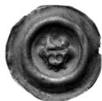
Ryc. 6. Brakteat śląski z Dąbrowy Górniczej-Łośnia. Skala 1:1.

Moneta należy do tzw. szerokich brakteatów śląskich (ryc. 6). Ma głęboki relief i wybitny wał. W jego obrębie widoczna jest głowa byka na wprost, z dużymi, wklęsłymi oczami. Rogi są grube, średniej długości, nie stykające się ze sobą. Pod rogami, a nad oczami, biegnie pozioma, wklęsła linia. Uszy są małe, z małymi wklęsłościami. Średnica 18–18,5 mm, waga 0,346 g.