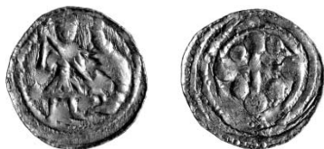
Ryc. 2. Denar Bolesława Krzywoustego, typ 4. Skala 1:1.

jest, że najbardziej liczny nie jest wcale typ poprzedzający (typ 3), a więc teoretycznie rzecz biorąc, dominujący niedawno na rynku, ale wcześniejszy typ 1 — najstarszy Bolesława Kędzierzawego. Typy zarówno starsze, jak i młodsze są stopniowo coraz mniej liczne.