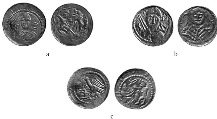
Ryc. 3. Denary Władysława II, a: typ 2, b: typ 3, c: typ 4. Skala 1:1.

Struktura skarbu nie odbija struktury pieniądza znajdującego się na rynku. Obowiązywała bowiem wówczas przeprowadzana co kilka lat okresowa wymiana i nakaz posługiwania się — przynajmniej w relacjach z państwem — jedynie monetą najnowszego stempla 6 . Skarb jest więc wynikiem celowej tezauryzacji. Podlegały jej zwłaszcza monety lepsze, emitowane według stopy 360 denarów z grzywny (typ 4 Władysława II oraz typy 1 i 2a Bolesława Kędzierzawego). Mniej zgromadzono monet nieco gorszych, emitowanych według stopy podwyższonej do 480 denarów z grzywny (typy 2b i 3 Kędzierzawego). Normy takie w momencie ukrycia skarbu do ziemi należały już jednak do przeszłości. Obowiązywała wówczas stopa pogorszona kolejny raz, co najmniej do 540 sztuk z grzywny. Takich niedobrych monet (typ 4 Kędzierzawego) dołączono zaledwie cztery egzemplarze. Istnieje prawdopodobieństwo, że ukrycie skarbu nastąpiło właśnie w związku z kolejną dewaluacją pieniądza. Jeśli właściciel