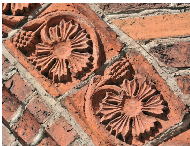
Ryc. 13. Drawsko Pomorskie, portal południowy, fryz obiegający archiwoltę. Fig. 13. Drawsko Pomorskie, southern portal, frieze surrounding archivolt.