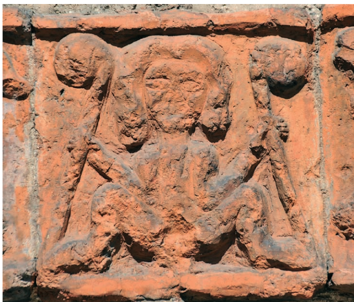
Ryc. 8. Drawsko Pomorskie, portal południowy, postać z pastorałami, w prawym fryzie. Fig. 8. Drawsko Pomorskie, southern portal, figure with crosiers, right frieze.