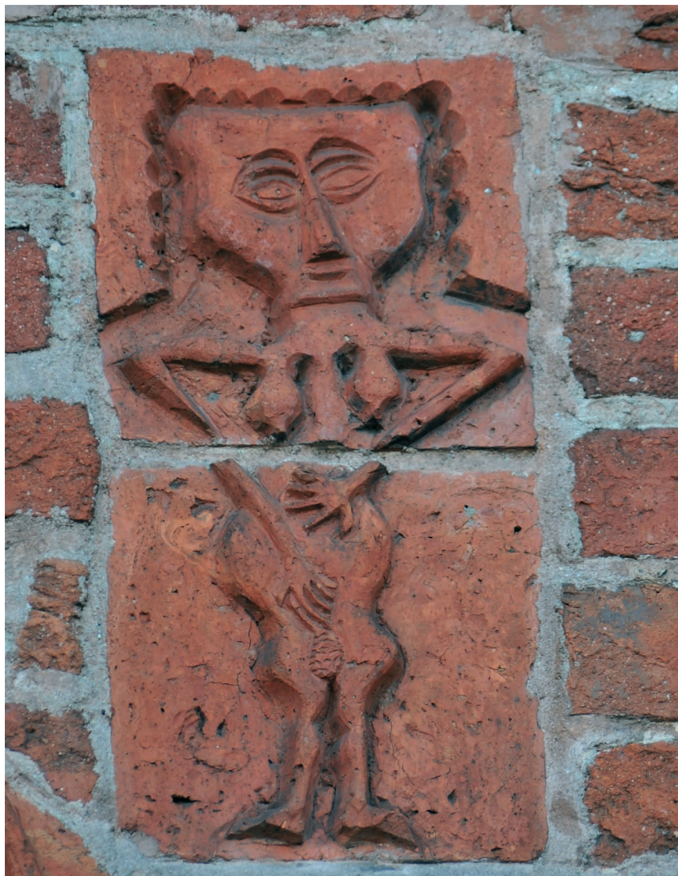
Ryc. 17. Drawsko Pomorskie, portal północny, Ewa. Fig. 17. Drawsko Pomorskie, northern portal, Eve.