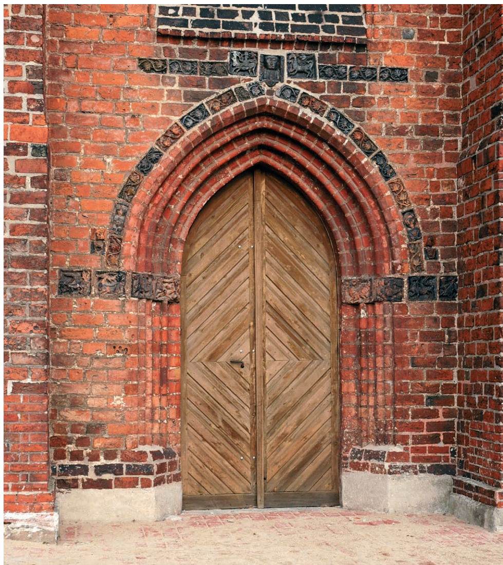
Ryc. 3. Dobiegniew, południowy portal korpusu nawowego. Fig. 3. Dobiegniew, portal of southern aisle.