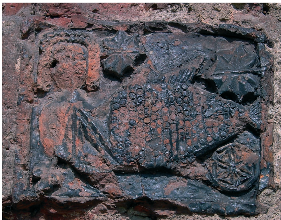
Ryc. 19. Dobiegniew, syrena, lewy fryz. Fig. 19. Dobiegniew, siren, left frieze.