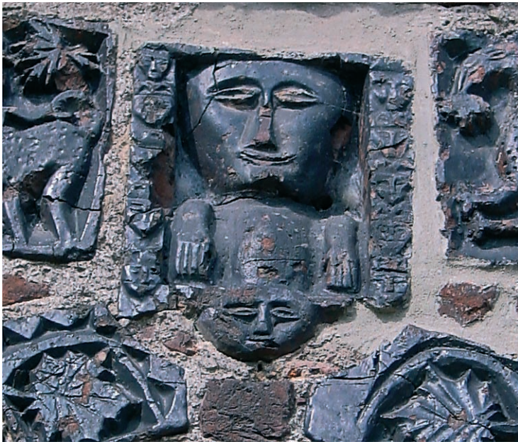
Ryc. 23. Dobiegniew, płyta nad kluczem archiwolt. Fig. 23. Dobiegniew, slab above keystone of the archivolt.