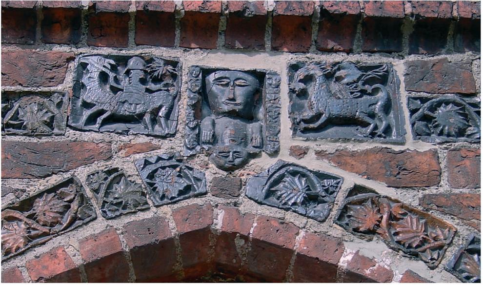
Ryc. 22. Dobiegniew, rzeźby w wierzchołku archiwolt. Fig. 22. Dobiegniew, sculptures in top of the archivolt.