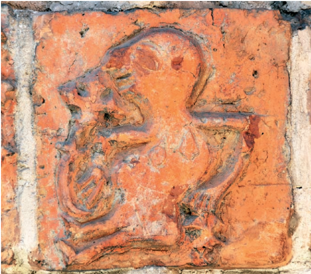
Ryc. 11. Drawsko Pomorskie, portal południowy, kobieta wachająca kwiat, w lewym fryzie. Fig. 11. Drawsko Pomorskie, southern portal, woman sniffing a flower, left frieze.