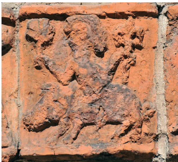
Ryc. 7. Drawsko Pomorskie, portal południowy, kobieta jadąca na świni, w prawym fryzie. Fig. 7. Drawsko Pomorskie, southern portal, woman riding on a swine, right frieze.