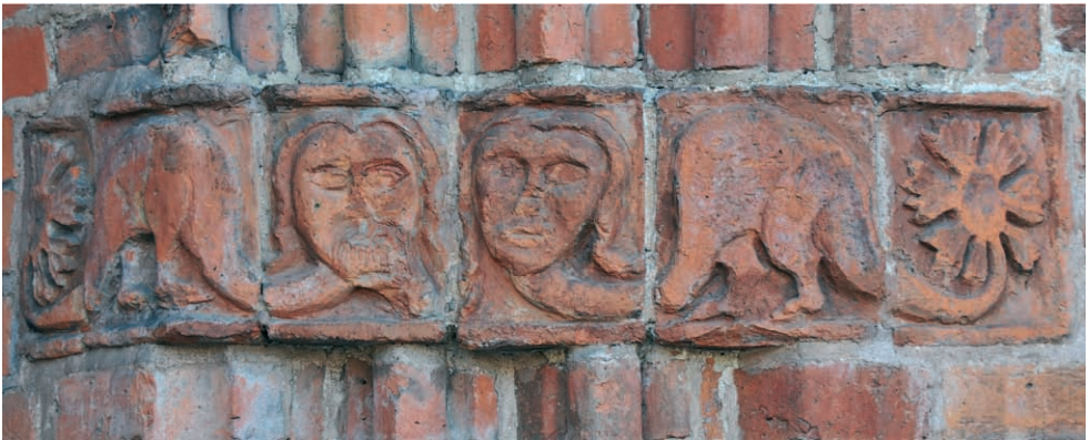
Ryc. 15. Drawsko Pomorskie, portal północny, smoki z ludzkimi głowami, w prawej nasadzie archiwolt. Fig. 15. Drawsko Pomorskie, northern portal, dragons with humans' heads, right base of archivolt.