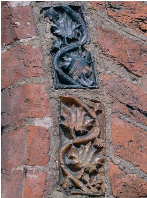
Ryc. 21. Dobiegiew, fryz wokół archiwolty. Fig. 21. Dobiegiew, frieze surrounding archivolt.