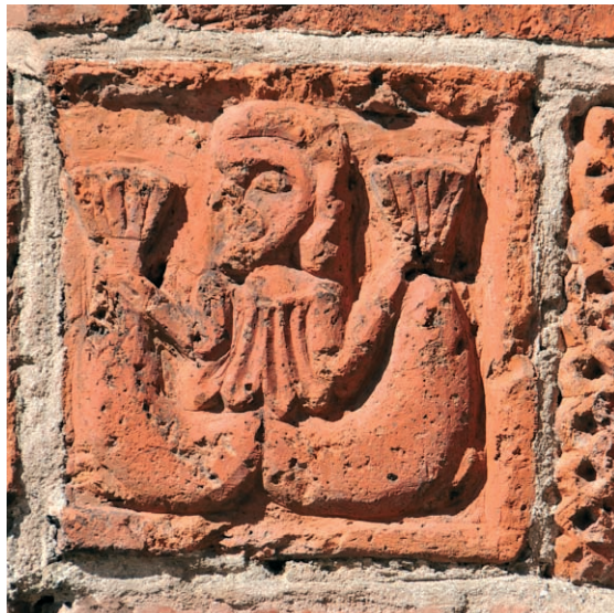
Ryc. 5. Drawsko Pomorskie, portal południowy, mężczyzna z rybami, w prawym fryzie.