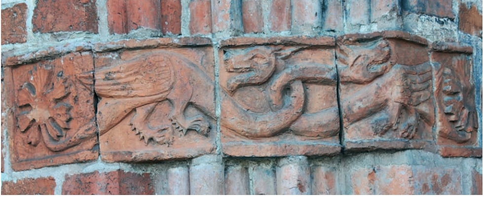
Ryc. 14. Drawsko Pomorskie, portal północny, smoki, w lewej nasadzie archiwolt. Fig. 14. Drawsko Pomorskie, northern portal, dragons, left base of archivolt.