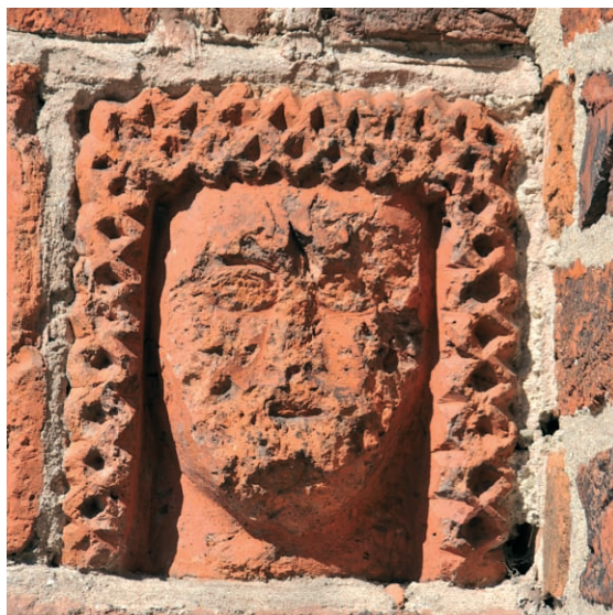
Ryc. 4. Drawsko Pomorskie, portal południowy, maska kobiety, w końcu prawego fryzu.