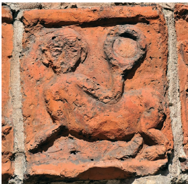
Ryc. 6. Drawsko Pomorskie, portal południowy, chłopiec centaur, w prawym fryzie. Fig. 6. Drawsko Pomorskie, southern portal, centaur boy, right frieze.