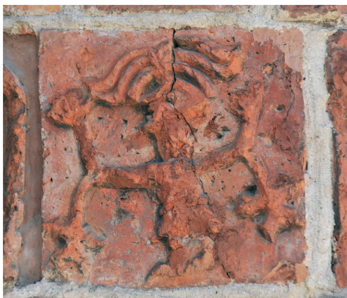
Ryc. 9. Drawsko Pomorskie, portal południowy, zagadkowa postać, w lewym fryzie. Fig. 9. Drawsko Pomorskie, southern portal, mysterious figure, left frieze.