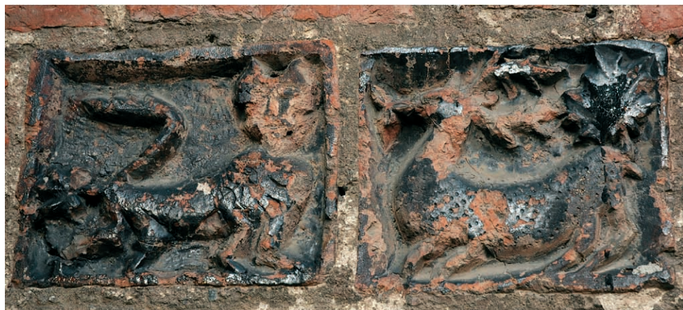
Ryc. 18. Dobiegniew, kot i koziorożec, lewy fryz. Fig. 18. Dobiegniew, cat and ibex, left frieze.