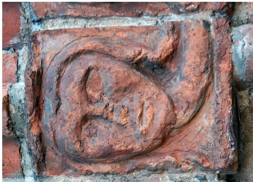
Ryc. 26. Zestawienie twarzy ze stali w Kołobrzegu (kolegiata NMP) i portalu północnego w Drawsku Pomorskim. Fig. 26. Comparison of faces from stalls in Kołobrzeg (the Co-Cathedral Basilica of the Assumption of the Blessed Virgin Mary) and northern portal in Drawsko Pomorskie.