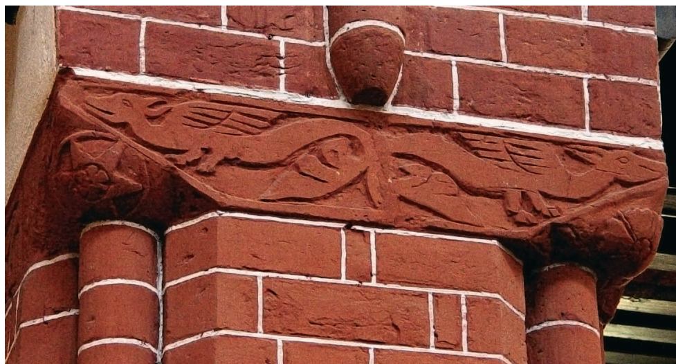
Ryc. 24. Eberswalde, Niemcy (Brandenburgia), kościół, kapitel filara międzynawowego. Fig. 24. Eberswalde, Germany (Brandenburg), church, capital of nave pier.