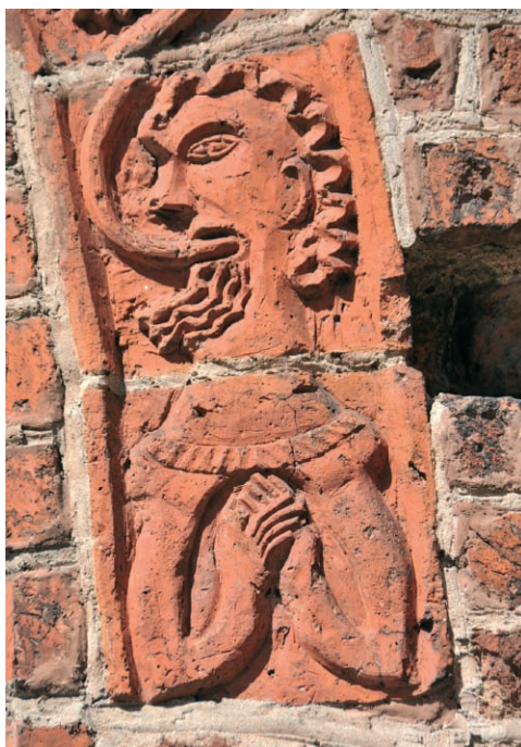
Ryc. 12. Drawsko Pomorskie, portal południowy, orant w nasadzie fryzu obiegającego archiwoltę. Fig. 12. Drawsko Pomorskie, southern portal, orans in the base of frieze surrounding archivolt.