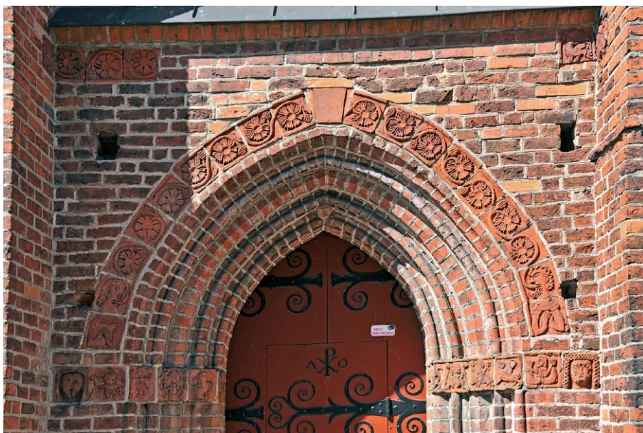
Ryc. 1. Drawsko Pomorskie, południowy portal korpusu nawowego, archiwolta. Fig. 1. Drawsko Pomorskie, portal of southern aisle, archivolt.