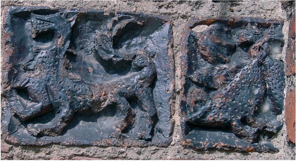
Ryc. 20. Dobiegiew, pies i geśi, prawy fryz. Fig. 20. Dobiegiew, dog and geese, right frieze.