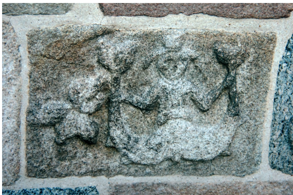
Ryc. 25. Lem, Dania (Jutlandia), kwadra z przedstawieniem syreny. Fig. 25. Lem, Denmark (Jutland), square granite ashlar stone with relief of the siren.