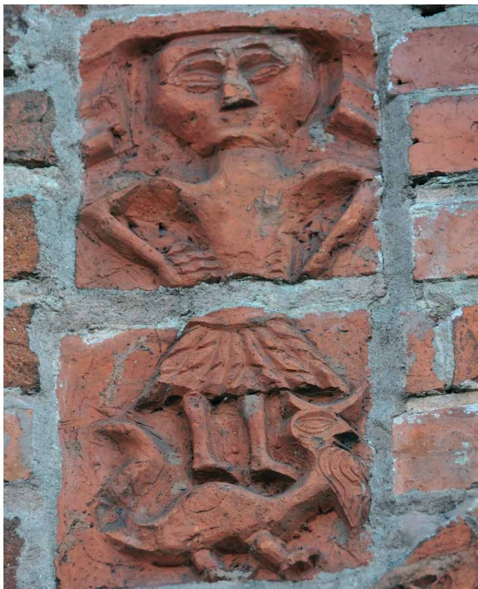
Ryc. 16. Drawsko Pomorskie, portal północny, Adam. Fig. 16. Drawsko Pomorskie, northern portal, Adam.