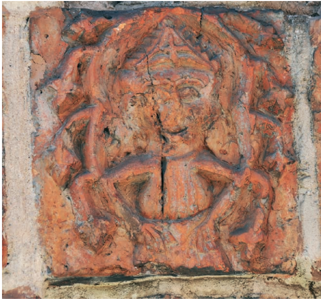
Ryc. 10. Drawsko Pomorskie, portal południowy, biskup, w lewym fryzie. Fig. 10. Drawsko Pomorskie, southern portal, bishop, left frieze.