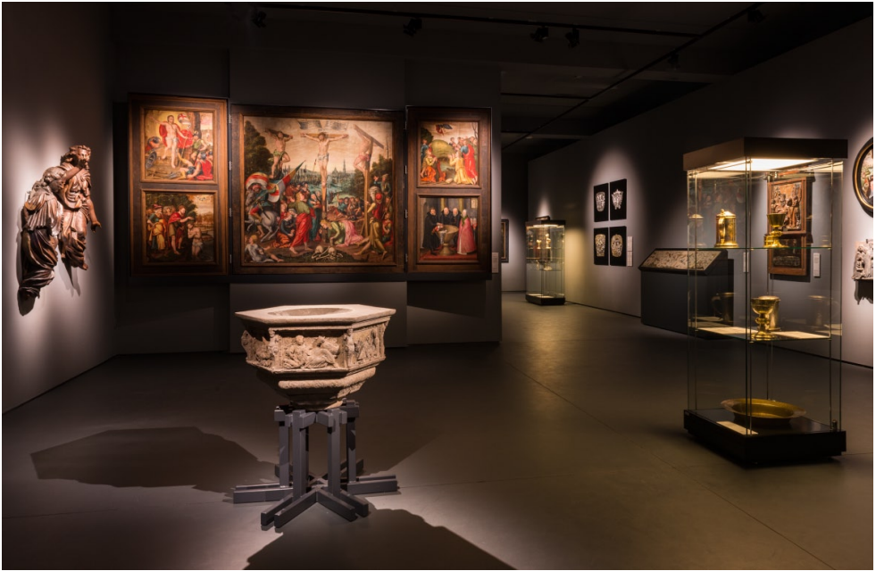
Wystawa „Ukryte znaczenia. Sztuka na Pomorzu w XVI i XVII wieku”. K. Gołębiewska, N. Laskowska