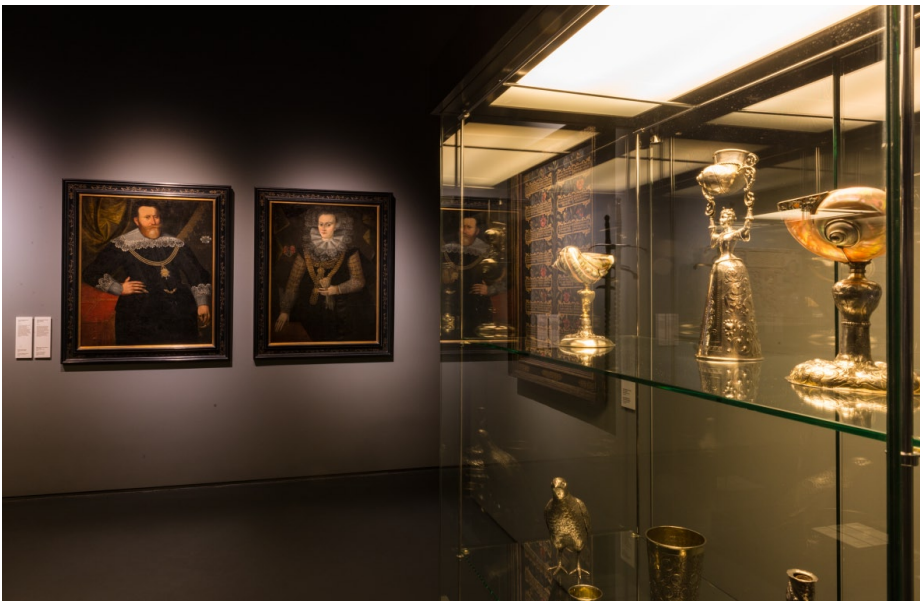
Wystawa „Ukryte znaczenia. Sztuka na Pomorzu w XVI i XVII wieku”. K. Gołębiowska, N. Laskowska