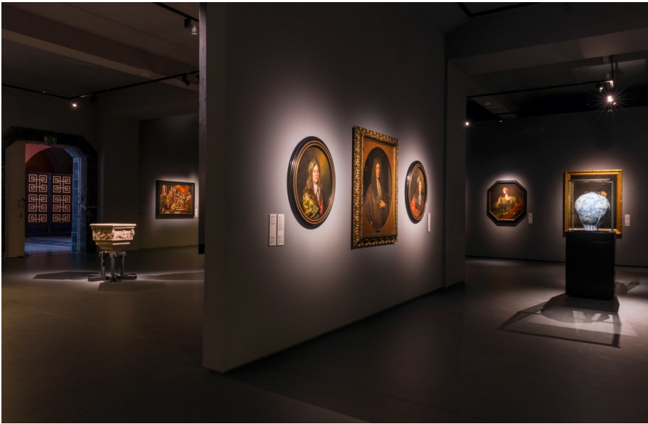
Wystawa „Ukryte znaczenia. Sztuka na Pomorzu w XVI i XVII wieku”. K. Gołębiowska, N. Laskowska