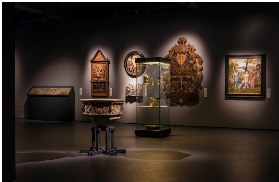
Wystawa „Ukryte znaczenia. Sztuka na Pomorzu w XVI i XVII wieku”. K. Gołbiowska, N. Laskowska