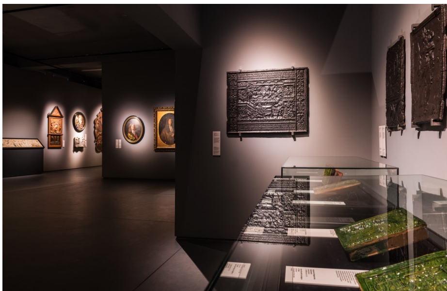
Wystawa „Ukryte znaczenia. Sztuka na Pomorzu w XVI i XVII wieku”. K. Gołębiowska, N. Laskowska