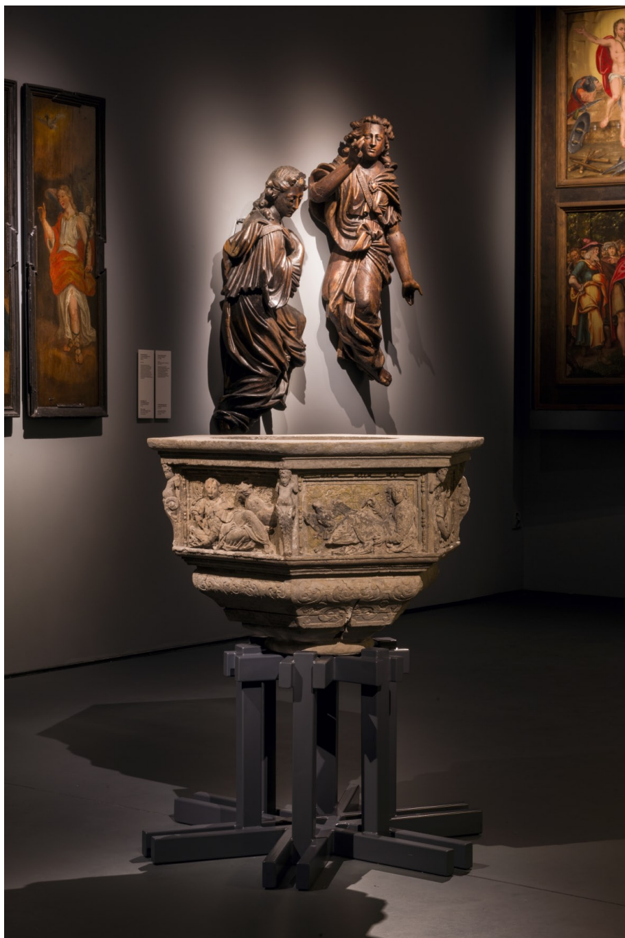
Wystawa „Ukryte znaczenia. Sztuka na Pomorzu w XVI i XVII wieku”. K. Gołębiowska, N. Laskowska