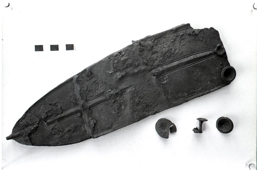
Ryc. 4. Archiwalna (z 1942 r.) fotografia klamry do pasa z Barnisławia, pow. Policki; Archiwum Działu Archeologii Muzeum Narodowego w Szczecinie, negatyw nr F.130/39