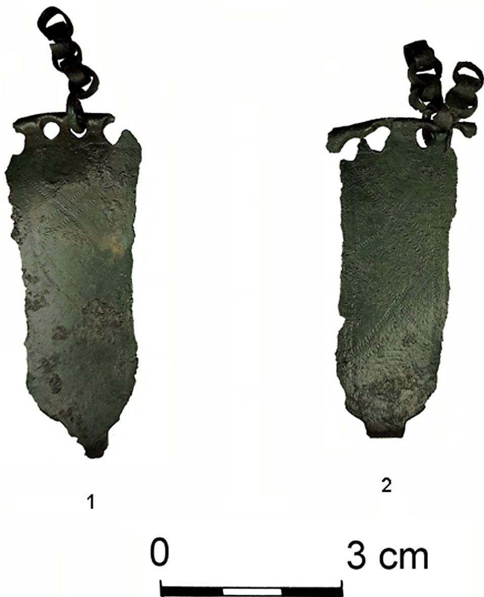
Ryc. 3. Długie, pow. stargardzki, stan. 1: 1 i 2 – kłamy do pasa z brązu. Fig. 3. Długie, Stargard district, site 1: 1 and 2 – bronze belt buckle.