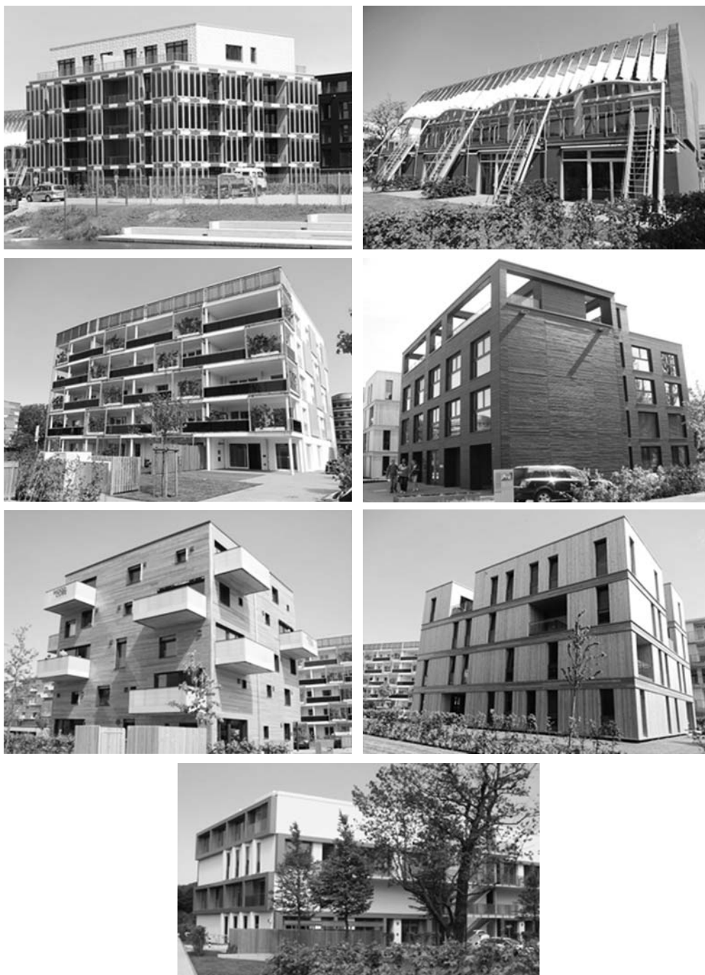
Fot. 9. Przykłady domów modelowych opracowanych w ramach projektów: Smart Material Houses , Smart Price Houses , Hybrid Houses