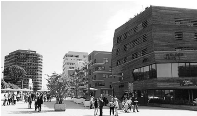
Fot. 7. Nowe centrum Wilhelmshurga w rejonie głównego wejścia do Wilhelmshurg Island Park . Budynki są realizacjami modelowymi pokazującymi możliwości współczesnej technologii w zakresie rozwiązań energoefektywnych