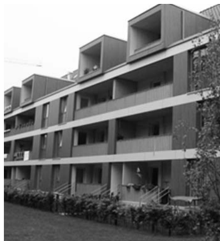
Fot. 5. Termomodernizacja w Kwartale Świata ( Weltquartier )