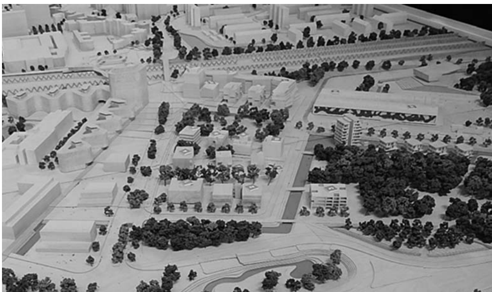
Fot. 6. Nowe zagospodarowanie centrum Wilhelmsburga w rejonie przystanku S-Bahn i głównego wejścia do Wilhelmsburg Island Park (tereny Międzynarodowej Wystawy Ogrodowej IGS 2013).

Jego główny rdzeń stanowią budynki modelowe, demonstrujące współczesną budowlaną myśl techniczną w elementy wystawowe zarówno IBA Hamburg, jak i IGS Hamburg. Model z centrum informacyjnego IGS 2013