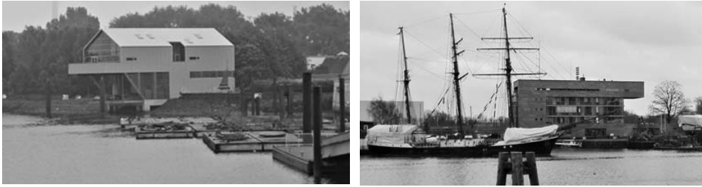
Fot. 2. i 3. Portowa tożsamość miejsca, architektoniczne środki budowania relacji miasto-woda w sytuacji zagrożenia powodziowego. (po lewej) centrum społeczne Dom Projektów (niem. Haus der Projekte – die Müge ) nad basenem Müggendorfer Zollhafen , (po prawej), Komisariat Policji Wodnej (obiekt spoza programu IBA Hamburg )

natywne opcje ochrony przeciwpowodziowej. Integralnym elementem studium było jego upublicznienie zakładające upowszechnienie wśród społeczności Hamburga nowoczesnej wiedzy o problematyce zabezpieczeń przeciwpowodziowych. Otwarto w ten sposób dyskusję na temat przyszłości Deichparku , który rozpoczęto tworzyć przez projekt pilotażowy Kreetsand 36 . Powstał on z potrzeby rozwiązania problemu zagospodarowania osadów nanoszonych do kanałów portowych wraz z falami powodziowymi. Jest to zbiornik wodny w południowo-wschodniej części Wilhelmsburga, którego zadaniem jest akumulowanie wody podczas przypiływu i wzmocnienie fali odpływowej, aby naniesione przez wodę osady każdorazowo wracały do morza. Poza walorami funkcjonalnymi, zbiornik stanowi urozmaicenie okolicznego krajobrazu.