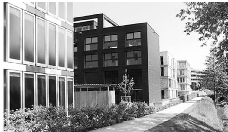
Fot. 8. Zespół zabudowy mieszkaniowej w centrum Wilhelmshurga stanowiący element ekspozycji rezultatów projektów Smart Material Houses , Smart Price Houses