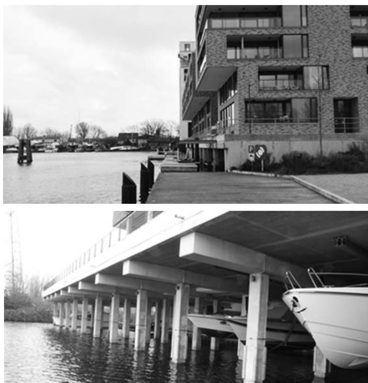
Fot. 12. Model Boathaus: budynek mieszkaniowy ze zintegrowanymi miejscami postojowo-garażowymi dla łodzi. Realizacje z rejonu Schloßinsel w Harburgu

IBA zrealizowano je poprzez rozwiązania innowacyjne. Przy Schellerdamm powstał mieszkaniowy kampus akademicki oferujący zróżnicowane formy mieszkaniowe studentom niedalekiego Technische Universität Hamburg-Harburg . Społeczność akademicka od długiego czasu jest motorem napędzającym lokalną gospodarkę, dlatego IBA Hamburg postanowiła zainwestować w budowę nowoczesnych akademików wpisanych w zespół budynków socjalnych, rozumianych jako poszerzony zasób dostępny dla osób, tak jak studenci, na starcie swojej kariery mieszkaniowej. Funkcjonowanie struktury mieszkaniowo-biurowej w rejonie dawnego dworca towarowego, znanego dziś też głównie dzięki silnej marce Channel Hamburg, pozwala na realizację ciekawych zespołów mieszkaniowych oferujących mieszkania komercyjne. Rejon Schlossinsel wchodzący w skład Harburger Binnenhafen kształtuje styk wody i lądu przez nietypowe obiekty w modelu Boathouse . Oferują one zintegrowane z budynkiem mieszkalnym przestrzenie parkingowo-garażowe dla łodzi motorowych, którymi dzięki powiązaniu kanałów dotrzeć można do centrum Hamburga – sprawniej niż drogą lądową [Rembarz 2018b].