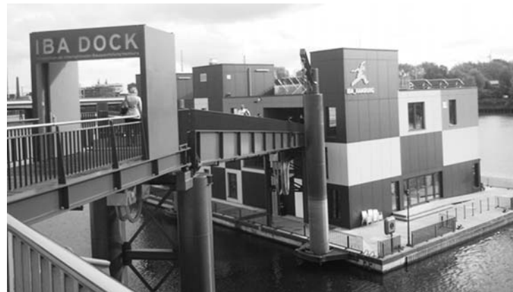
Fot. 10. Przykład pływającej architektury: IBA DOCK w basenie Müggenburger Zollhafen