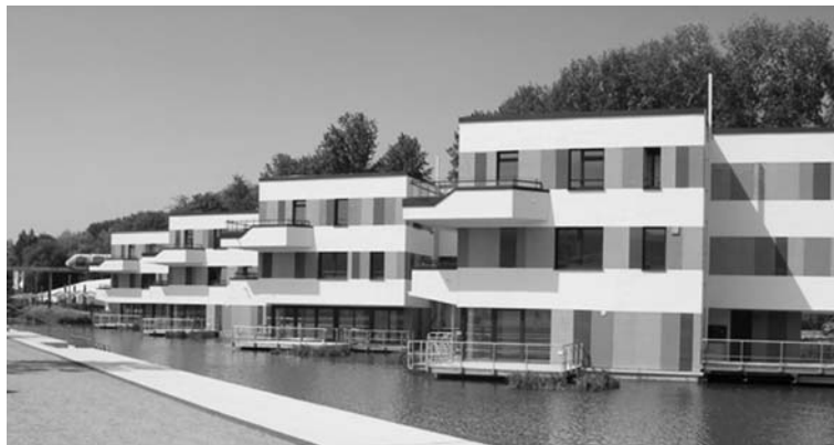
Fot. 11. Przykład pływającej architektury: zespół WaterHouses u wejście do Wilhelmsburg Island Park