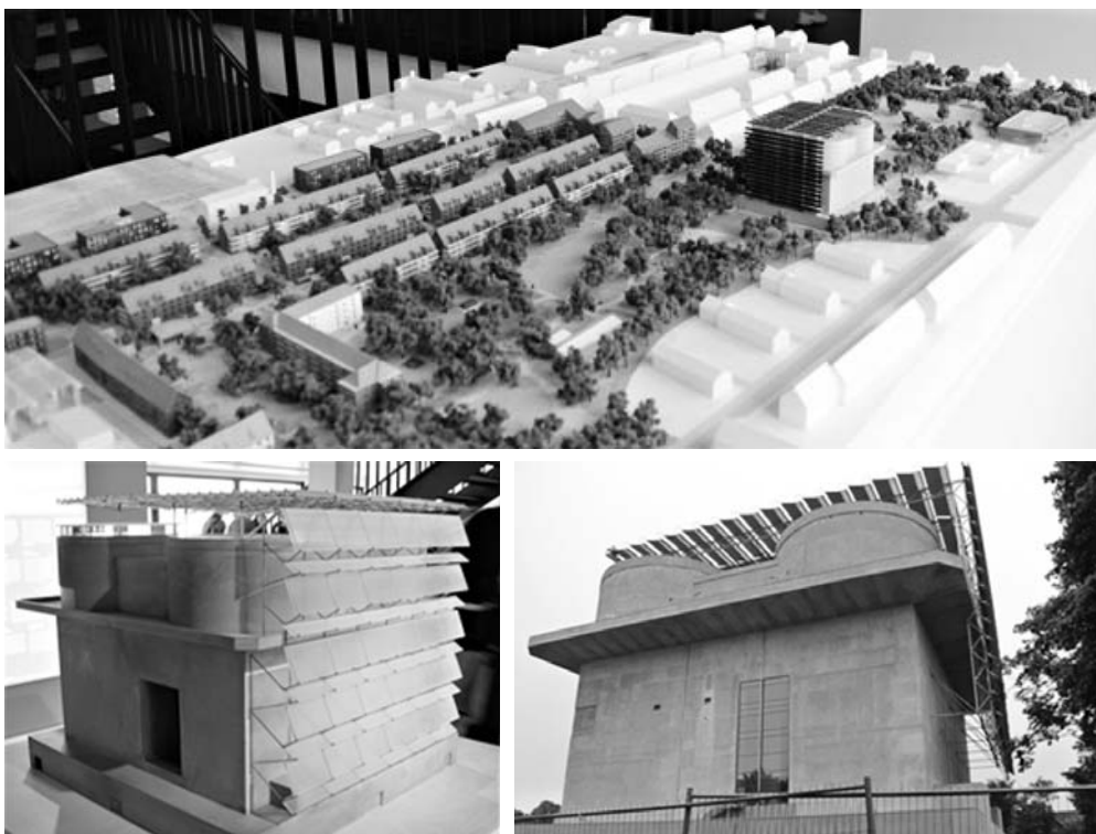
Fot. 4. Bunkier Energii – pomnik historii przekształcony w elektrownię zasilającą 3000 okolicznych budynków mieszkalnych tzw. Światowego Kwartalu (niem. Weltquartier ). Modele z centrum informacji IBA Dock

rasem widokowym na okolicę (fot. 4). Drugi projekt, Wzgórze Energii Georgswerder powstał na terenie składowiska odpadów przemysłowych, w tym odpadów toksycznych, zajmującego powierzchnię 45 hektarów. Z czasem, miejsce to okazało się być dużym zagrożeniem dla mieszkańców Hamburga i budziło bardzo duże niepokoje społeczne. W związku z brakiem możliwości utylizacji tak ogromnej ilości śmieci, postanowiono zabezpieczyć teren wysypiska. Hałda została przykryta membraną, jej brzegi ukształtowano w taki sposób, aby uniemożliwić przedostawanie się toksyn do wód gruntowych, a następnie całość przykryto ziemią. Na wzgórzu zainstalowano turbiny wiatrowe, panele słoneczne i konstrukcję kładki widokowej otaczającej szczyt hałdy. Poza typowymi rozwiązaniami służącymi pozyskiwaniu odnawialnej energii, wykorzystywane są tu też wyloty odprowadzane z zakrytego składowiska odpadów. Obecnie wzgórze funkcjonuje jako przestrzeń rekreacyjna dla mieszkańców Hamburga, oraz punkt informacyjny, w którym m.in. można dowiedzieć się, w jaki sposób monitorowany jest stan wysypiska i zagrożenia związane z obecnością toksycznej materii.