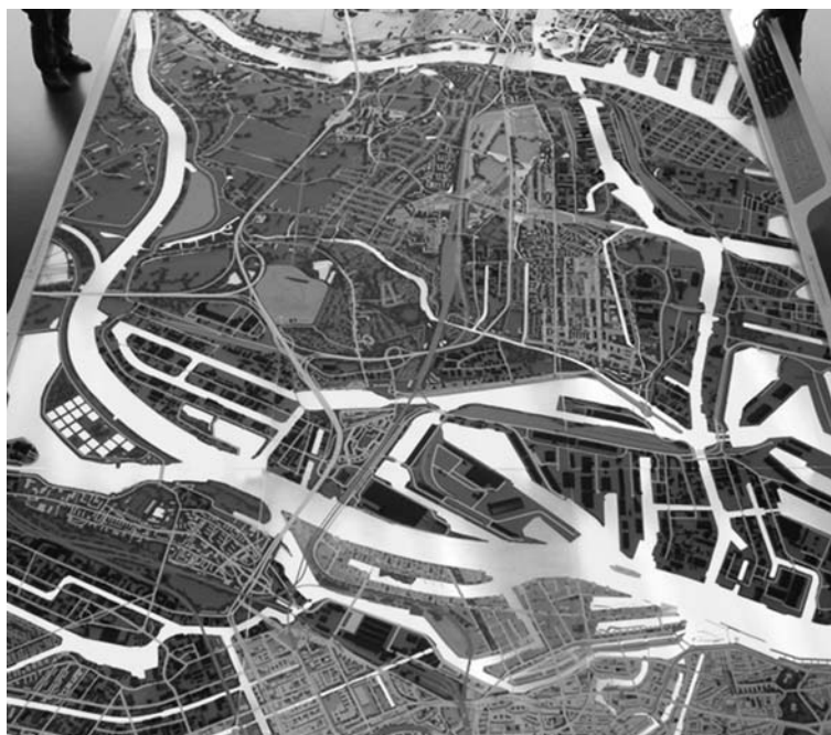
Fot. 1. Model z centrum informacji IBA Dock ilustrujący charakterystykę Wyspy Wilhelmsburg z charakterystycznym układem kanałów portowych i odnóg Łaby.

Czytelne są główne osie komunikacyjne niekorzystnie rozcinające teren objęte IBA Hamburg. U dołu widoczny układ założenia Hafencity sąsiadujący bezpośrednio z historycznym centrum Hamburga.