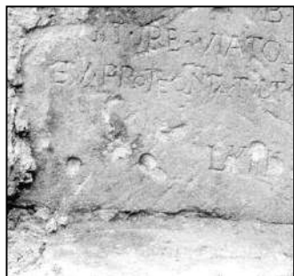
Ryc. 1. Ślady na epitafium odkrytym w Urzędowie

które pochodzą z wcześniejszego, XVII-wiecznego kościoła. Drewniany kościół istniał tam zapewne już w XV w., jednakże, jak wynika m.in. z dokonanych odkryć, już w 1622 r. istniał kościół murowany. Na jednej z płyt widnieje napis: SIMON PISARSKI ANO DNI 1618.