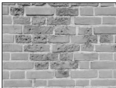
Ryc. 4. Przykład wymiany cegieł na kościele Ścięcia św. Jana Chrzciciela w Chojnicach