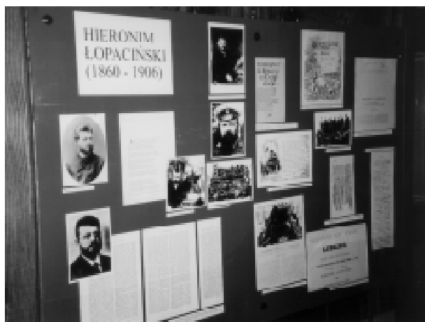
Fragmety wystawy jubileuszowej