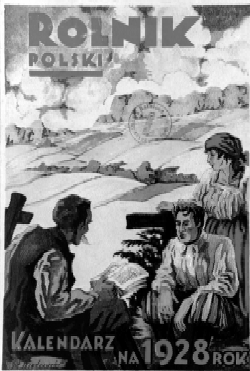
Uł. Pomorska Drukarnia Rolnicza S. A. Toruń