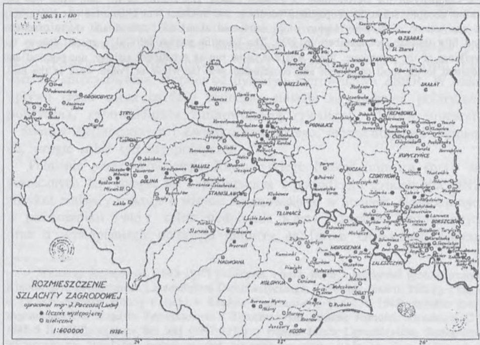
Fot. 2. Rozmieszczenie szlachty zagrodowej