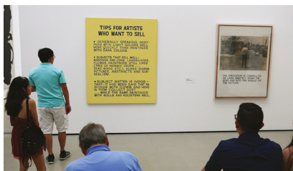
15. John Baldessari, Rady dla artystów, którzy chcą sprzedać swoje dzieła (1966–1968) i Widz musi (1967–1968)

15. John Baldessari, Tips for Artists Who Want to Sell (1966–1968) i The Spectator Is Compelled (1967–1968)