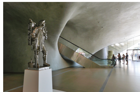
11. Hall wejściowy i ruchome schody prowadzące do górnej galerii, po lewej stalowa rzeźba Jeffa Koonsa Kiepenkerl (1987)