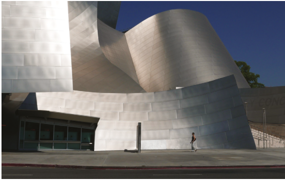
7. Walt Disney Concert Hall, proj. Frank Gehry (2003)