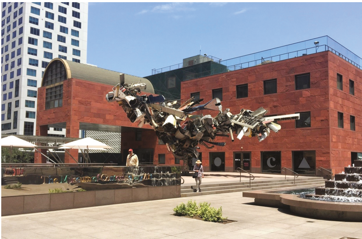
6. Museum of Contemporary Art (MOCA), proj. Arata Isozaki (1986)