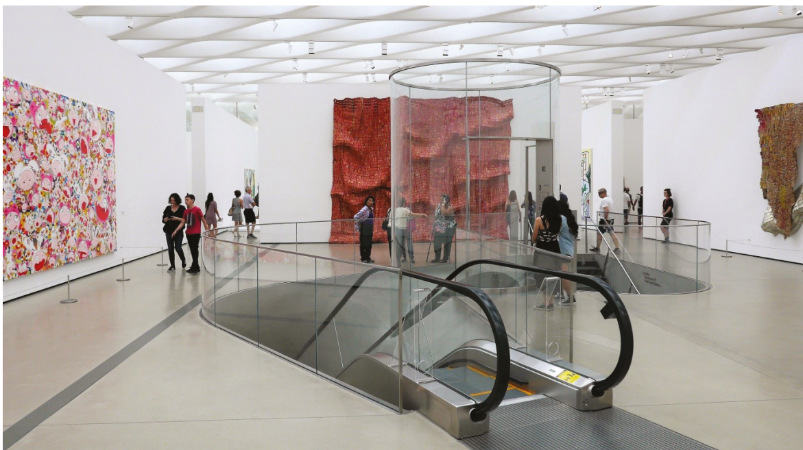
12. Wnętrze górnej galerii ze stałą ekspozycją malarstwa i rzeźby

12. Interior of the upper gallery with permanent painting and sculpture display