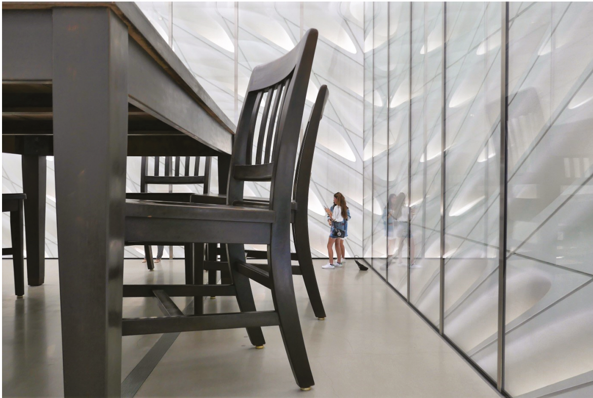
16. Robert Therrien, Pod stołem (1994)