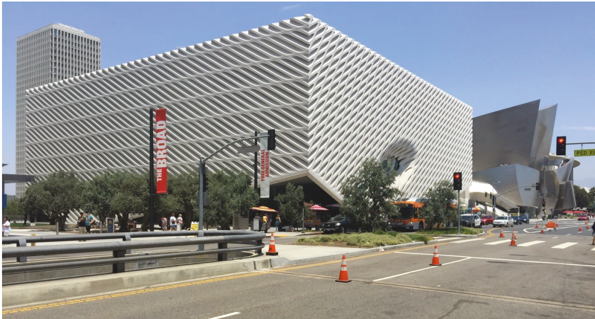
9. Na pierwszym planie Muzeum The Broad, proj. Diller Scofidio + Renfro (2015), w głębi po prawej Walt Disney Concert Hall