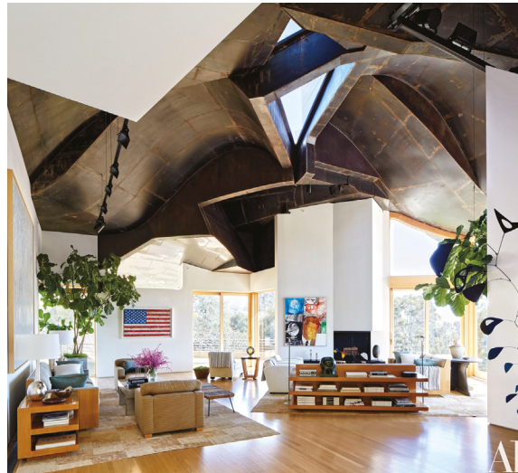
5. Salon z ekspresyjnie ukształtowanym metalowym dachem, na ścianach obrazy: Jaspiera Johnsa Flaga (1967), Roberta Rauschenberga drukowany jedwab z podobizną Johna F. Kennedy'ego (1963), po prawej rzeźba Esowata winorośl Alexandra Caldera (1946), w środku rzeźba Głowa – hełm nr 3 Henry'ego Moore'a (1960)

Do kolejnego spotkania Elia Broada i Franka Gehry'ego doszło kilka lat później, podczas przygotowywania planów Walt Disney Concert Hall – największego projektu milenijnego