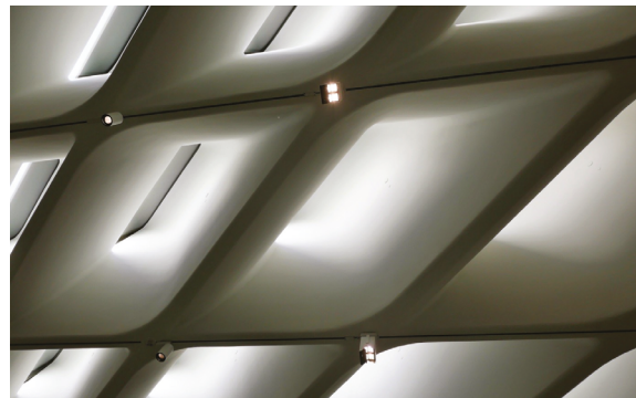
10. Detal ażurowego stropu doświetlającego wnętrza górnej galerii

Ażurowe przegrody, z których zbudowane zostały ściany i dach budynku, uformowano w taki sposób, aby do wnętrza wpuszczać światło dzienne, ale skutecznie odcinać bezpośrednie promieniowanie słoneczne. Dzięki programom komputerowym, analizującym położenie słońca w różnych godzinach i porach roku, możliwym stało się precyzyjne