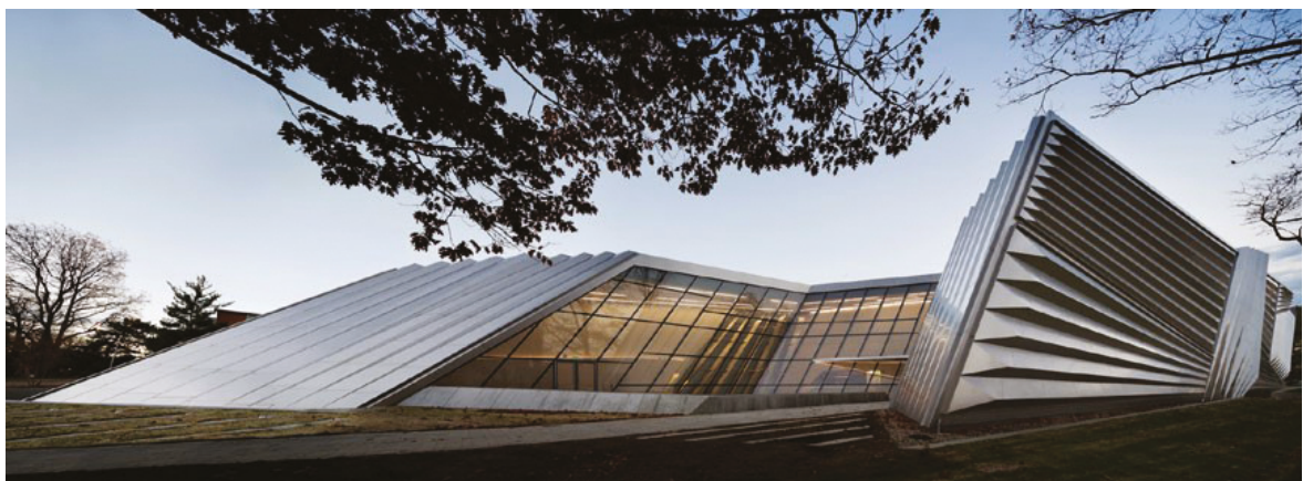
8. Broad Art Museum w Michigan State University, proj. Zaha Hadid (2012)

W 2010 r. zorganizowano międzynarodowy konkurs