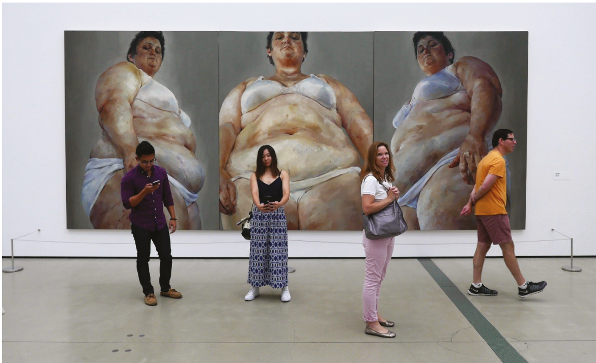
17. Jenny Saville, Strategia (1970)