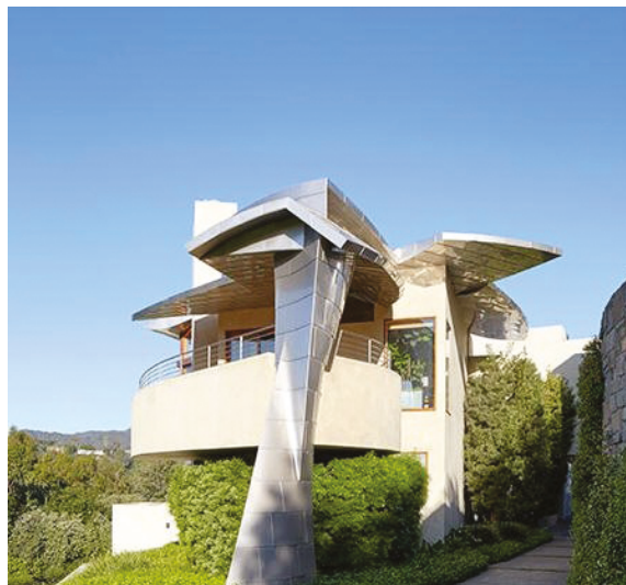
4. Rezydencja w Brentwood zbudowana wg koncepcji Franka Gehry'ego, sfinalizowana przez architektów z firmy Langdon Wilson

Eli Broad jest członkiem rad nadzorczych wielu szacownych instytucji muzealnych, m.in. Museum of Contemporary Art w Los Angeles, Museum of Modern Art w Nowym Jorku i Smithsonian Institution w Waszyngtonie. Jest kawalerem Legii Honorowej i posiadaczem Carnegie Medal of Philanthropy. Jednak jest coś fascynująco niekoherentnego pomiędzy jego publicznym wizerunkiem – kostywnego, nienagannie ubranego tradycjonalisty i twardego przedsiębiorcy oglądającego z wszystkich stron każdego wydawanego dolara, a jego zwariowaną, barwną, i niespójną kolekcją awangardowej sztuki oraz ekstrawaganckimi budynkami, które zostały wzniesione za jego pieniądze.