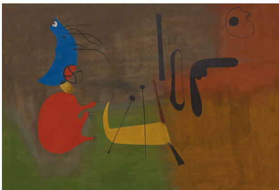
2. Joan Miró, Obraz (1933), The Broad Collection, https://www.thebroad.org/art/joan-miró/painting-march-13-1933