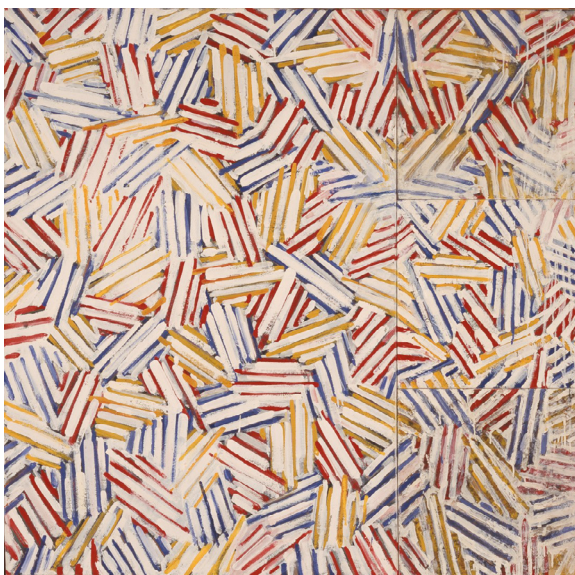
3. Jasper Johns, Bez tytułu (1975), https://www.thebroad.org/art/jasper-johns/untitled-83