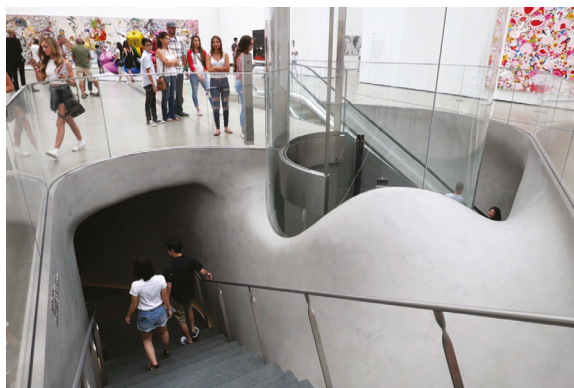
18. Schody i winda, które prowadzą zwiedzających przez magazyn

W październiku 2017 r. Eli Broad ogłosił, że z powodu złego stanu zdrowia wycofuje się z życia publicznego i rezygnuje z działalności filantropijnej.