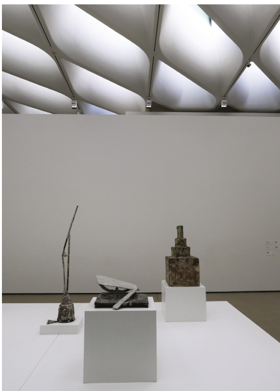
13. Cy Twombly, Madame D'O (1999), Nad Morzem Jońskim (1988) i Zjednoczeni (2000–2009)

12. Interior of the upper gallery with permanent painting and sculpture display