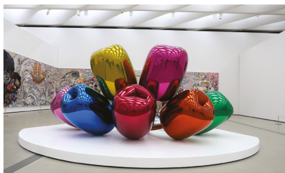
14. Jeff Koons, Tulipany (1995–2004)

13. Cy Twombly, Madame D'O (1999), By the Ionian Sea (1988), and United (2000–2009)