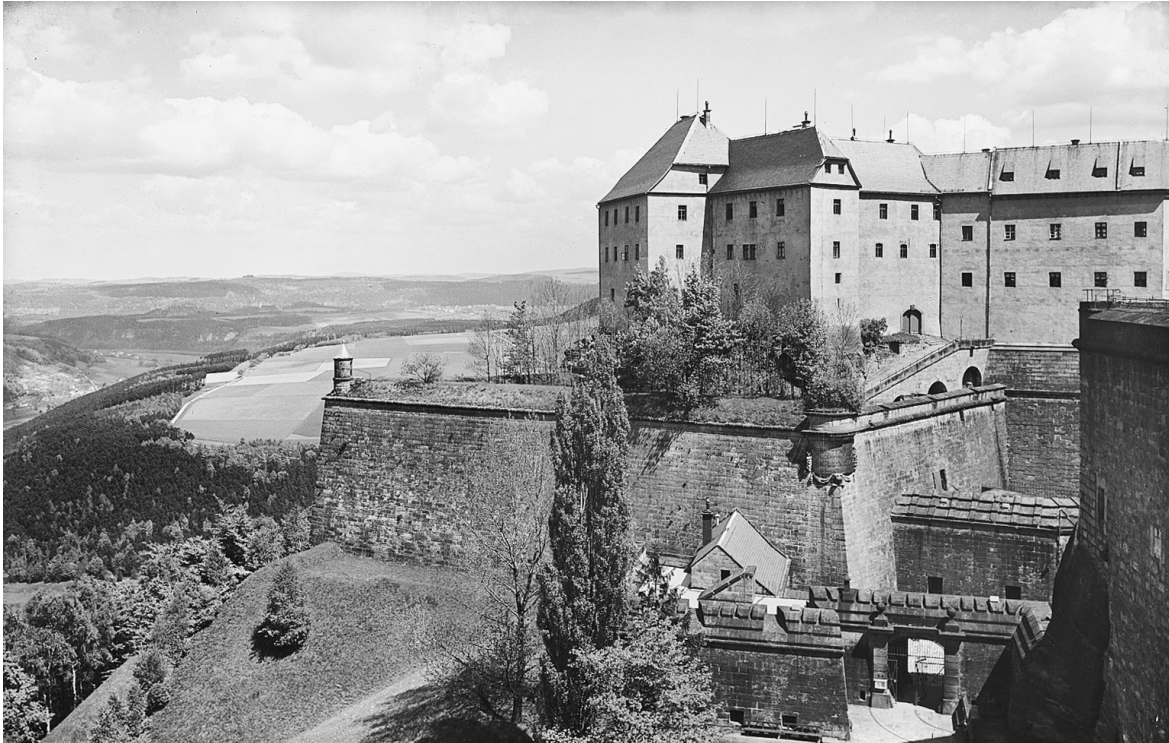
11. Festung Königstein – w podziemiach twierdzy w czasie wojny ulokowano zbiory Grünes Gewölbe

11. Festung Königstein: in the cellar of the fortress the Grünes Gewölbe collection was deposited