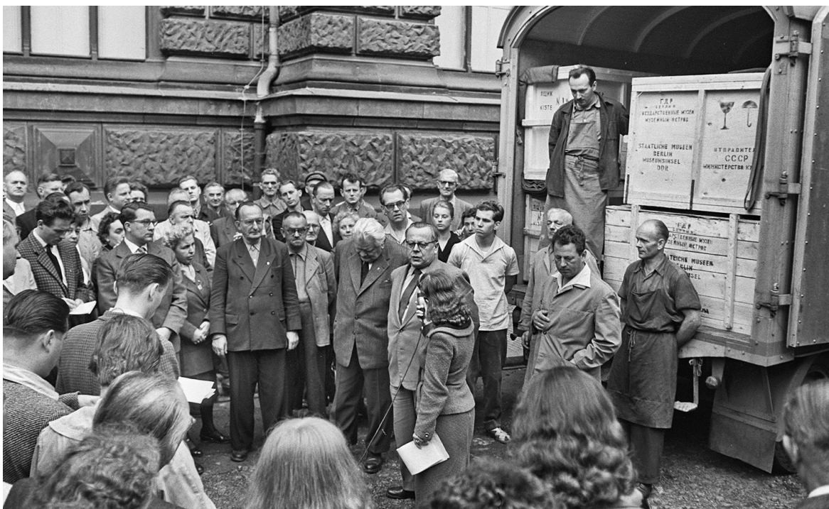
12. Transport zbiorów Grünes Gewölbe przekazanych Niemieckiej Republice Demokratycznej przez Związek Radziecki w 1958 r.

12. Transportation of the Grünes Gewölbe collection handed over to GDR by the Soviet Union in 1958