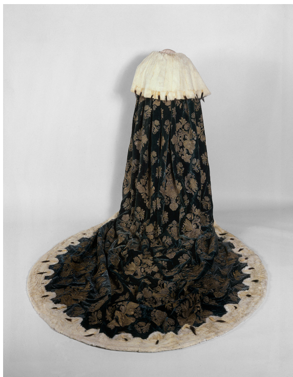
3. Płaszcz koronacyjny króla Augusta III Sasa

2. Coronation regalia of King Augustus III elector of Saxony and his wife Maria Josepha