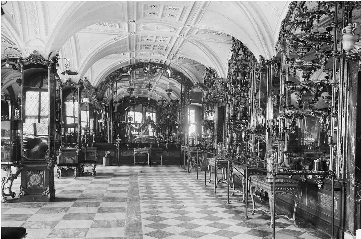
1. Zbiory władców Saksonii przechowywane w Grünes Gewölbe, lata 30. XX w.

1. Collections of Saxony rulers kept at the Grünes Gewölbe, the 1930s