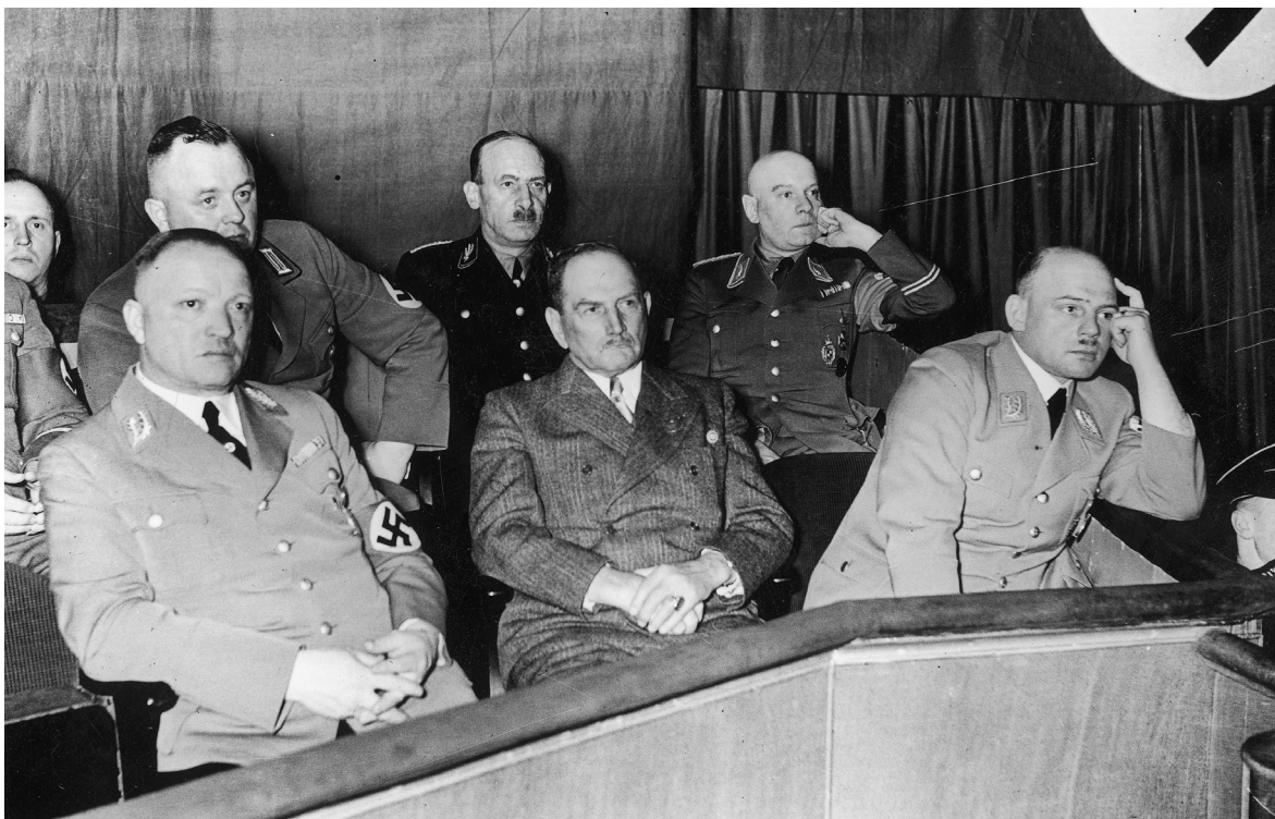
7. Gauleiter Saksonii Martin Mutschmann (pierwszy z lewej w dolnym rzędzie) wraz z gauleiterem Bawarii Franzem von Eppem i gauleiterem Turynгии Fritzem Sauckelem (z prawej) w 1937 r.