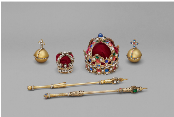
2. Regalia koronacyjne króla Augusta III Sasa i jego żony Marii Józefy

2. Coronation regalia of King Augustus III elector of Saxony and his wife Maria Josepha