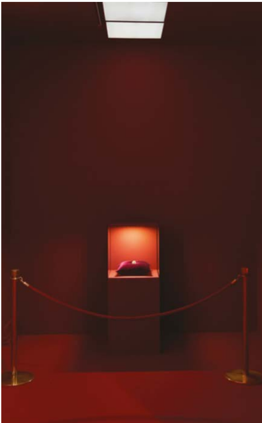
3. Przestrzeń ekspozycyjna Arcydzieło