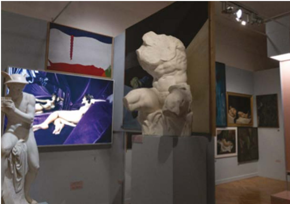
4. Przestrzeń ekspozycyjna Ciało w przestrzeni