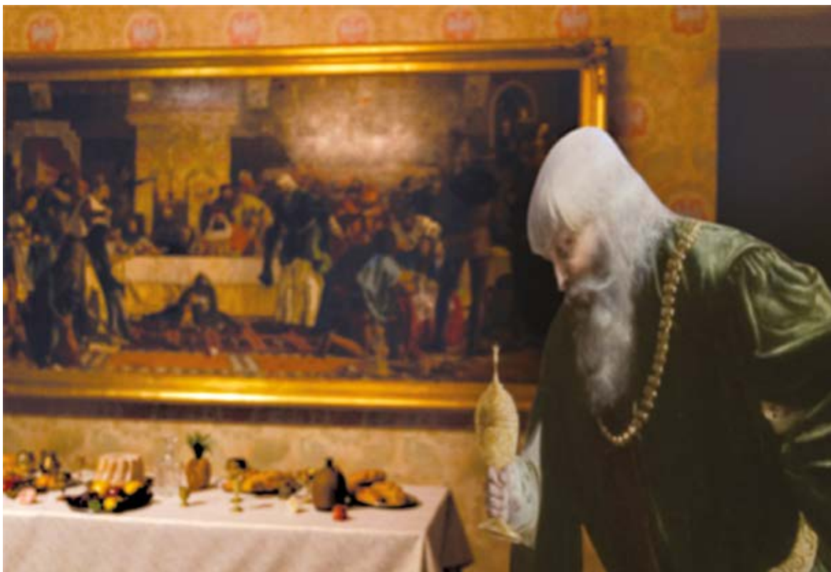
1. Przestrzeń ekspozycji Weż udział w uczcie