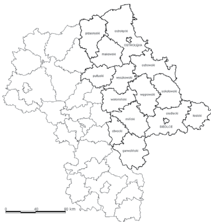
Rysunek 1 Obszar badania (oznaczony wytłuszczzoną linią granic) na tle współczesnego województwa mazowieckiego