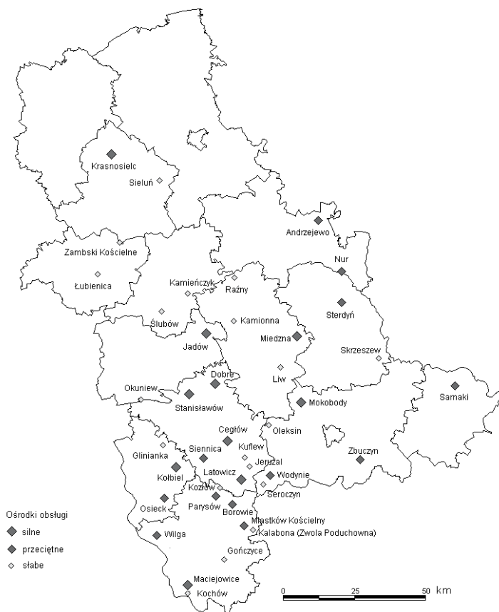
Rysunek 6 Miasta zdegradowane we wschodniej części województwa mazowieckiego według stopnia wykształcenia funkcji obsługi

ponadgimnazjalnym). W minionym czasie informacje uległy częściowej dezaktualizacji, trzeba jednak wspomnieć, że określone relacje między miejscowościami rzadko ulegają rewolucyjnym zmianom (pomijając sytuacje szczególne, jak zmiany sytuacji ekonomicznej uwarunkowane utworzeniem lub likwidacją większych zakładów pracy). Określone informacje mają zatem wartość przede wszystkim porównawczą. W rezultacie procedury weryfikacyjnej, wartości wskaźnika centralności, zawierające się pierwotnie w skali 100-punktowej, zostały uproszczone do trzech szczebli funkcji obsługi: A – poziom wysoki (silny ośrodek, reprezentujący ponadlokalny poziom obsługi, pod względem niektórych funkcji wykraczający poza obszar własnej gminy), B – poziom przeciętny (poziom obsługi typowy dla większości ośrodków gminnych), C – poziom niski (pozostałe miejscowości).