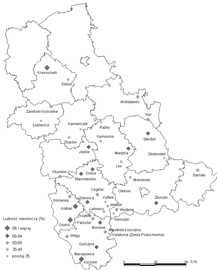
Rysunek 5 Miasta zdegradowane we wschodniej części województwa mazowieckiego według udziału ludności nierolniczej