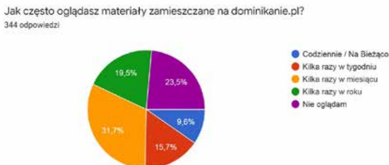
Wykres 3. Częstotliwość oglądania materiałów na portalu dominikanie.pl

33,1% „chyba nie”, a 14% „zdecydowanie nie”. W pytaniu otwartym o to, z czym kojarzy się pojęcie „katolicki Netflix” część osób odpowiedziało, że z portalem dominikanie.pl, jednak pojawiały się również odpowiedzi, że kojarzy im się „Serwer z treściami wiary katolickiej filmy podcasty wszystko w jednym miejscu”, „Zbiór seriali, filmów i treści z przesłaniem katolickim”. 74,8% pytanych odpowiedziało, że zna portal dominikanie.pl, 25,2% nie zna.