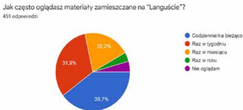
Wykres 2: Częstotliwość oglądania materiałów na kanale „Langusta na palmie”.