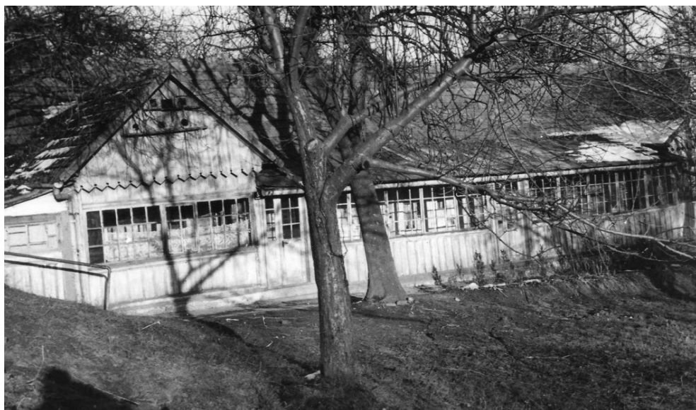
Dom ks. Józefa Depowskiego na tzw. Górze w Ropczycach, fot. po 1945 r. (Archiwum Generalne Służebniczek Dębickich w Dębicy).