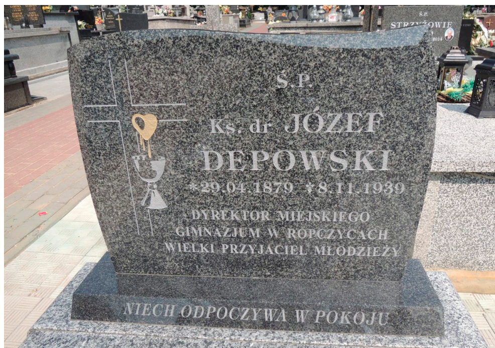
Grobowiec ks. Józefa Depowskiego na cmentarzu w Ropczycach (podana błędna data urodzenia), fot. Tomasz Krzyżowski 2018 r.