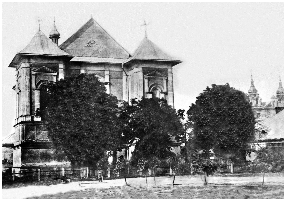
Kościół ormiański pw. św. Kajetana w Tyśmienicy na Pokuciu, lata 30. XX w. (Zbiory Autora w Krakowie).