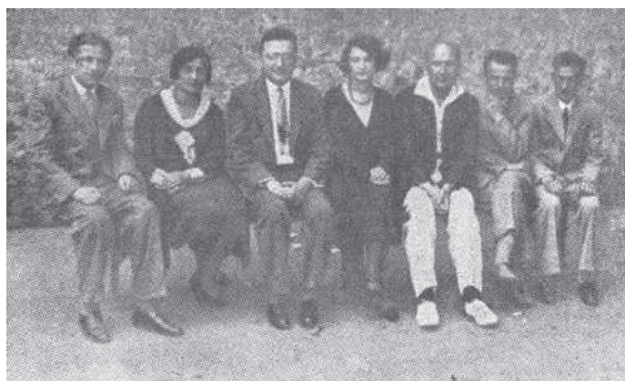
Fot. 10. Grupa nauczycieli szkoły średniej „Safa Berura” 42