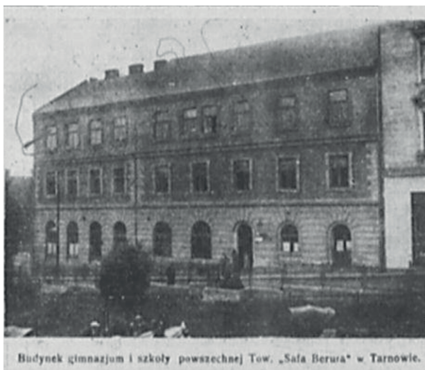
Budynek gimnazjum i szkoły powszechnej Tow. „Safa Berura” w Tarnowie.

W początkowej fazie działalności warunki lokalowe były wystarczające do realizacji zadań obu szkół. Wraz ze wzrostem liczebnym uczniów stały się one nieodpowiednie. Mając to na uwadze, Zarząd Towarzystwa „Safa Berura” dokonał rozbudowy pomieszczeń gimnazjum przez dobudowanie drugiego piętra w 1928 roku.