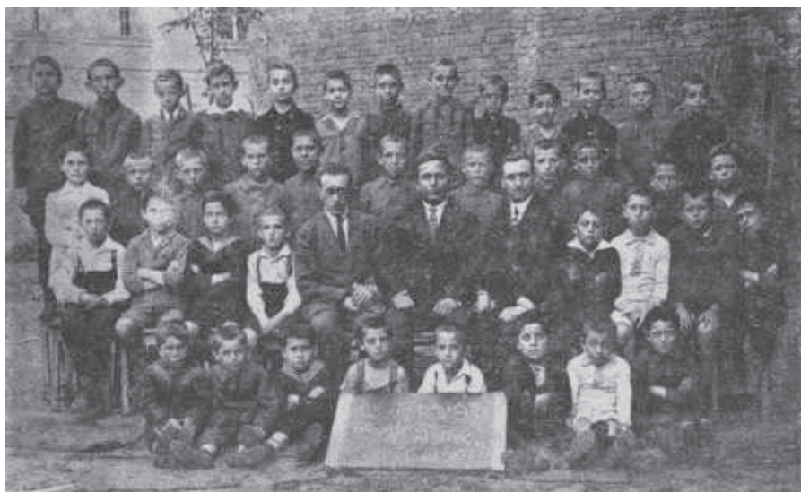
Fot. 5. Uczniowie szkoły powszechnej „Safa Berura”, początek lat dwudziestych 28

W okresie drugiej Rzeczypospolitej tarnowska młodzież żydowska wyznania mojżeszowego mogła pobierać naukę w państwowych szkołach średnich, jednakże