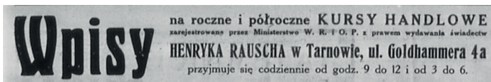
Fot. 14. Zapisy na kursy handlowe do szkoły Henryka Rauscha 65

W zakresie przysposobienia zawodowego działała w Tarnowie Jednoroczna Szkoła Przysposobienia Kupieckiego przedsiębiorcy izraelskiego Henryka Rauscha. W latach 1900/1901-1913/1914 funkcjonowała ona jako dzienna dwuklasowa szkoła handlowa prowadząca również kursy jednoroczne 64 .