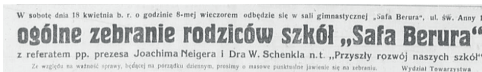
Fot. 13. Informacja prasowa o zebraniu rodziców uczniów uczęszczających do szkół „Safa Berura” w Tarnowie 61

W roku szkolnym 1936/37 do 4-klasowego gimnazjum nowego ustroju i klas VII-VIII gimnazjum dawnego typu uczęszczało 221 młodzieży, w tym 128 chłopców i 93 dziewczęta, przekraczając nawet w klasach II bez uzasadnienia przepisową normę uczniów 60 .