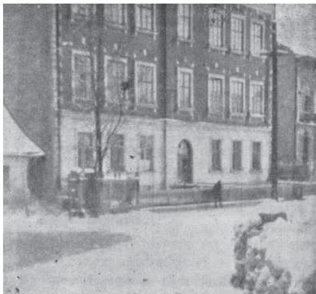
Fot. 3. Budynek szkoły fundacji barona Maurycego Hirscha 15

Przy szkole istniały również pracownie rzemieślnicze, gdyż fundacja barona M. Hirscha miała także na celu kształcenie zawodowe. Od roku 1899 w budynku mieściła się też szkoła handlowa dla dziewcząt, w której uczyły się one szycia. Ponadto szkoła przede wszystkim kształciła dziewczęta jako dobre gospodynie domowe, które winny umieć również gotować, prać, prasować, szyć, czytać, pisać i liczyć.