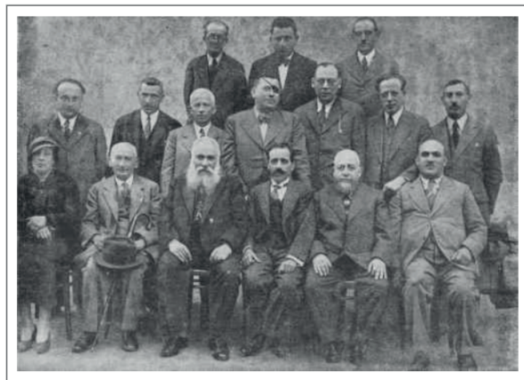
The managing committee members of Safa Berura in 1933

języka hebrajskiego i literatury oraz religii. W programie wychowania występowały również akcenty wychowania obywatelskiego, w ramach którego zapoznawano uczniów z polską tradycją narodową.