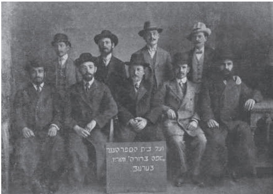
Fot. 6. Pierwszy komitet Towarzystwa „Safa Berura” w Tarnowie 29

Zostały utworzone dwie szkoły, najpierw Prywatne Gimnazjum i Liceum Koedukacyjne Towarzystwa Żydowskiej Szkoły Powszechnej i Średniej „Safa Berura”, a później Prywatne Gimnazjum Koedukacyjne Stowarzyszenia Żydowskiego Nauczycieli Szkół Powszechnych i Średnich.