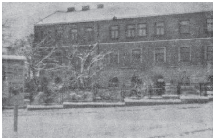
Fot. 7-8. Budynek szkoły powszechnej i gimnazjum hebrajskiego „Safa Berura” w Tarnowie przy ul. Św. Anny 34