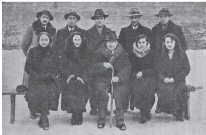
Fot. 9. Nauczyciele z gimnazjum „Safa Berura” w Tarnobrzegu w 1935 roku 41

Kadra nauczycielska miała w zasadzie pełne kwalifikacje pedagogiczne. W roku szkolnym 1936/1937 w gimnazjum „Safa Berura” pracowano 13 nauczycieli, w tym 8 mężczyzn i 5 kobiet 40 . Pełnych kwalifikacji nie mieli tylko nauczyciele uczący ćwiczeń cielesnych i zajęć praktycznych.