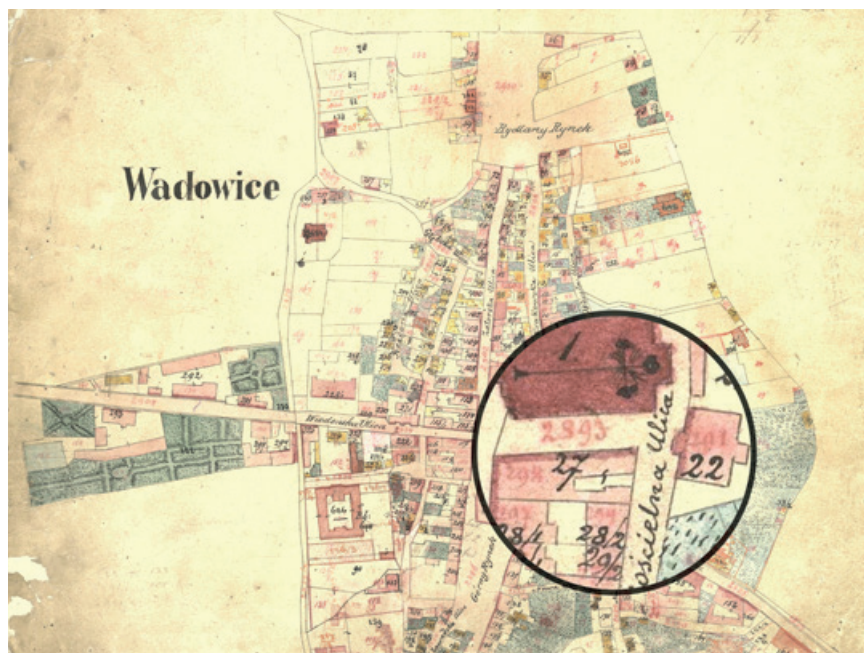
Centrum Wadowic uwiecznione na austriackiej mapie indykacyjnej. Na parceli budowlanej nr 27, położonej w pobliżu kościoła farnego, zarysowano czerwonym kolorem murowaną kamienicę oraz jej nowy numer konskrypcyjny: 298. Do 1879 r. stanowiła ona własność Antoniny Rouge. To najbardziej znana kamienica w Wadowicach – dom rodzinny Karola Józefa Wojtyły.

Powstaje pytanie o czas, w którym korzystano z owych map – szczególnie z tej przechowywanej w Bielsku-Białej. Pewne wnioski można wyciągnąć, analizując