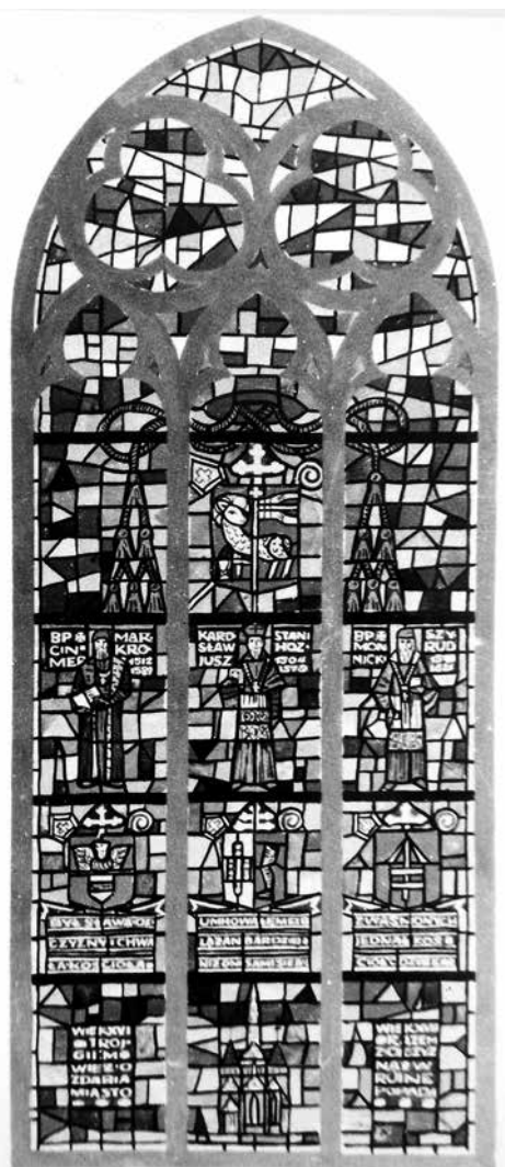
Il. nr 4: projekt witraża z herbami biskupów warmińskich