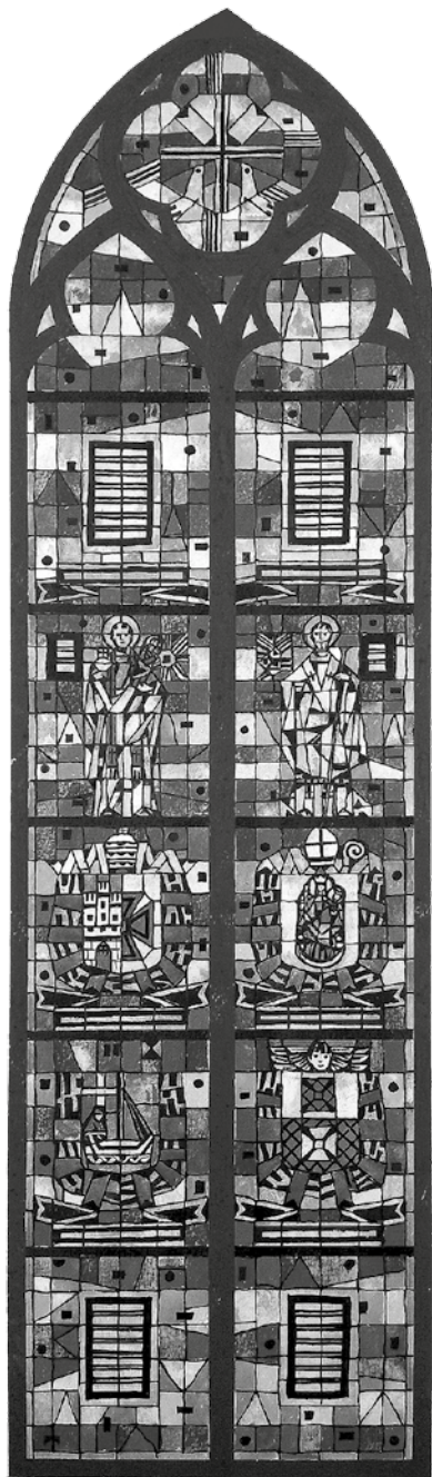
Il. nr 5: projekt witraża z postaciami św. Jacka i św. Mikołaja