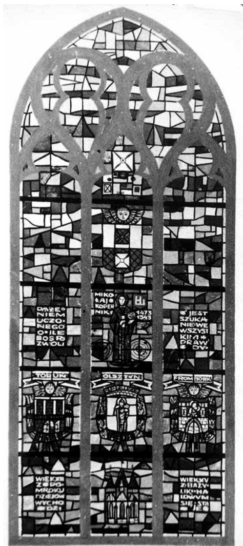
Il. nr 3: projekt witraża z postacią Mikołaja Kopernika