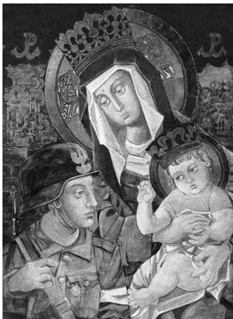
Il. nr 2: Zdjęcie obrazu Matki Boskiej Armii Krajowej