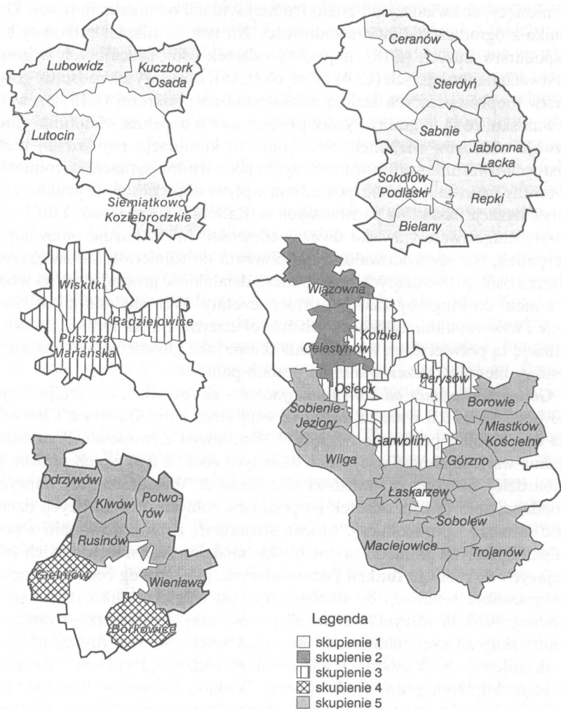
Rys. 2. Rozmieszczenie 5 wyodrębnionych skupień badanych gmin wiejskich.

Gminy wielofunkcyjne – skupienie 2. obejmuje dwie gminy powiatu otwockiego: Wiązowna i Celestynów. Są to jednostki krańcowo odmienne od wcześniej przedstawionych skupień. Cechuje je najwyższy poziom pozarolniczych dochodów ludności (C1), najwyższa wartość (C2) wydatków inwestycyjnych oraz najwyższy wskaźnik: osób z wykształceniem wyższym i policealnym, osób utrzymujących się z pracy najemnej oraz z pracy na rachunek własny poza rolnictwem. Są to cechy najbardziej pożądane z punktu widzenia wielofunkcyjnego rozwoju obszarów wiejskich. Występuje tu najniższy