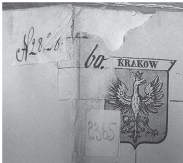
Fot. 2. Trzy różne naklejki z numeracją. Numerek Iżyckich „2365”.

duje się on na książce należącej do G. Zbyszewskiego 158 . Dodatkowo często numer danej książki zapisano ołówkiem lub czerwoną kredką na okładce czy stronie tytułowej. Starsze typy naklejek należały m.in. do Z. Zbyszewskiego oraz P. Zbyszewskiej.