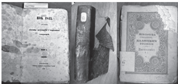
Fot. 1. Trzy różne przykłady zniszczeń: (od lewej) zagrzybienie, nadpalenie i oberwanie oprawy. Źródło: MBP w Tarnowie, sygn.: Mag-178880, Mag-178482, Mag-178856. Zdjęcie: M. Sobol-Kiełbania

Charakterystyczne dla kolekcji są naklejane na górnym brzegu książek i czasopism papierowe znaczkę z numerem w obrębie księgozbioru. Niestety kolejni właściciele naklejali na stare oznaczenia kolejne, nowsze i w ten sposób te pierwsze stały się częściowo nieczytelne. Najnowsze na-