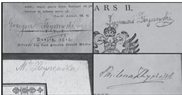
Fot. 3. Przykładowe podpisy (od lewego górnego rogu):