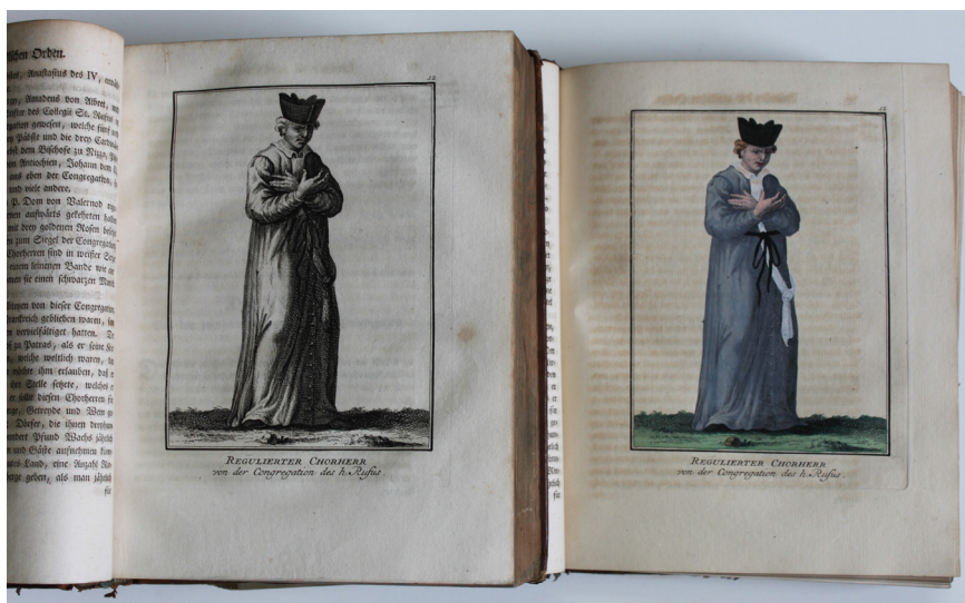
Fot. 7. Ausführliche Geschichte aller geistlichen und weltlichen Kloster- und Ritterorden für beyderley Geschlecht...

W dawnych księgozbiorach szczecińskich nie mogło zabraknąć publikacji dotyczących św. Ottona z Bambergu. Spośród książek poświęconych Apostołowi Pomorza Zachodniego można wymienić rocznicowe wydawnictwo opublikowane w Szczecinie w 1824 r.: Das ist das Ottobüchlein, darinnen einfältiglich beschrieben steht, wie die Pommern mit Hilfe Gottes durch ihren Apostel Otto zum Christenthum sind bekehret worden : eine Schrift für die pommersche Jugend auch dem lieben christlichen Bürgers- und Bauersmanne ganz nützlich zu lesen von Ernst Bernhardt . Książeczka, adresowana do szerokiego grona odbiorców, do dzieci, młodzieży i dorosłych, została wydana w 700. rocznicę chrztu Pomorza. W omawianym zasobie przechowywane są trzy egzemplarze tego wydawnictwa. Dwa pochodzą z księgozbioru archiwum 61 , jeden posiada pieczętkę Towarzystwa