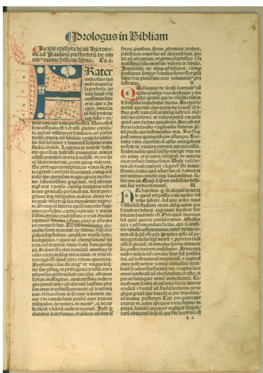
Fot. 1-2. Biblia Latina , Basel 1487.

przechowywany w bibliotece APSz – będący 14. edycją z 1706 r. – posiada frontyspis, trzy całostronicowe sztychy, jak też stylową oprawę z epoki 16 .