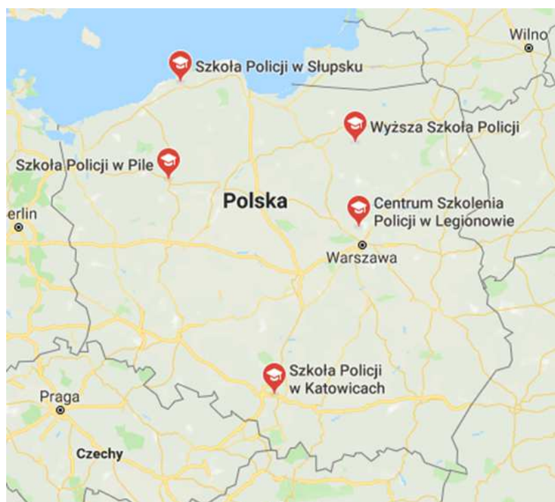
Rys. 1. Umiejscowienie szkół policyjnych w Polsce.