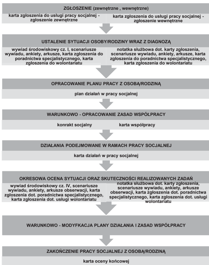
Schemat 2. Model i narzędzia pracy socjalnej realizowane w Ośrodku Pomocy Społecznej Dzielnicy Bielany