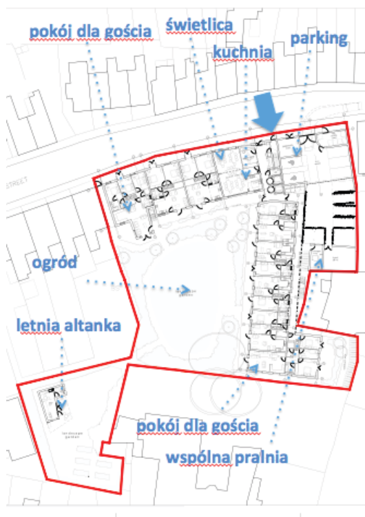
Rys. 2 Przykładowy projekt architektoniczny cohousingu z naniesionymi funkcjami