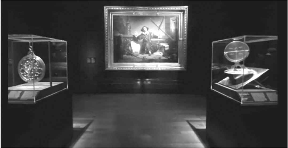
4. JAN MATEJKO, „ASTRONOM KOPERNIK, CZYLI ROZMOWA Z BOGIEM”, 1873, OLEJ NA PŁÓTNIE, 225 × 315 CM, NA WYSTAWIE W THE NATIONAL GALLERY W LONDYNIE, OBRAZ WYPOŻYCZONY Z COLLEGIUM NOVUM UNIwersYTETU JAGIELLOŃSKIEGO. STRONA INTERNETOWA: HTTPS://WWW.BRITISHPOLES.UK/KOPERNIK-MATEJKI-WYSTAWIONY-W-LONDYŃSKIEJ-NATIONAL-GALLERY-PIERWSZY-POLSKI-OBRAZ-W-HISTORII/ , DOSTĘP 21 VIII 2023

ności. Wystawa łącząca naukę i sztukę została otwarta dla publiczności 21 maja i miała zakończyć się 22 sierpnia 2021 roku. Ze względu na cieszącą się popularność kultowym dziełem i wysoką frekwencją odwiedzających The National Gallery ostatecznie zdecydowano się przedłużyć wystawę o tydzień – polskie dzieło można było podziwiać do 30 sierpnia (The National Gallery, 2020).