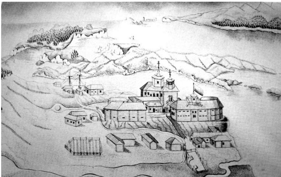
Port Pawłowski na wyspie Kodiak

ności miejscowej, opłacała podróże misjonarzy i dofinansowywała budowę kolejnych świątyń etc. 4 .