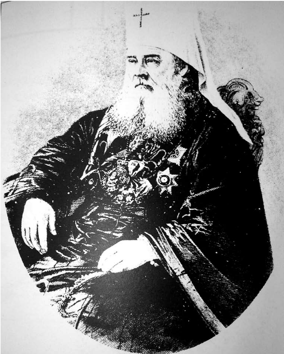
Metropolita Innocenty Weniaminow (1797-1879)

bowiem nauczano w j. rosyjskim i kodiak-uleckim (alutiiq) 9 . Należy podkreślić, że słowniki opracowane przez ks. Weniaminowa, przy wydatnej pomocy ks. Niczwietowa miały