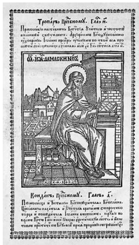
Św. Jan Damasceński, Triod kwietny, Lwów 1642, k. 6v (na podstawie < http://old.stsl.ru/manuscripts/staropachatnye-knigi/1069 >)

Proces powstawania coraz bardziej dopracowanych i funkcjonalnych ksiąg ilustrowały, według Ślozki, dzieje powstania antologionu, czyli minei świętecznej, stanowiącej wybór z wersji miesięcznej, którą częściowo zastępowała, głównie w uboższych parafiach, nie mających całego zestawu (tj. 12) tomów 45 : „Міней Избранная названая Янтологіонъ, з дневныхъ Мѣа кождого пѣній, що найпереднѣйшіе выбравши, недостаткови людскому прикладомъ скороченя иншихъ речій сталася” 46 . W ten sposób Ślozka usankcjonował