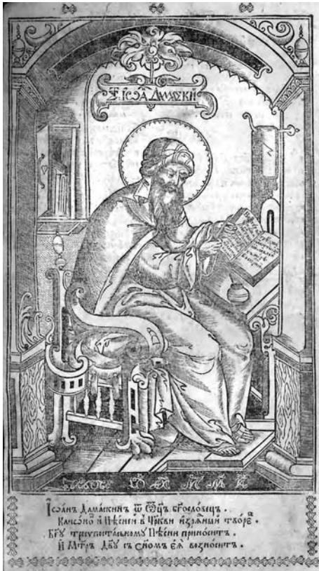
Św. Jan Damasceński, Oktoich , Lwów 1630, k. 34v (Biblioteka Jagiellońska, nr sygn. 589055 III)

jest tworem św. Jana („твореніе отчасти [...] Юанна”) 39 – został przezeń „stworzony lub skrócony” („Книга [...] оутворенная люво скороченная”) 40 . Tym samym przypominają o istnieniu wcześniejszej jeszcze tradycji hymnograficznej w Kościele 41 , którą Jan twórczo wykorzystał. Wspomniany wyżej lwowski wydawca w dedykacji do archimandryty Izajasza Sulatyckiego rozlegle opisywał przeprowadzoną przez Jana reformę śpiewu cerkiewnego, polegającą na selekcji, redukcji i dostosowaniu pieśni do systemu 8 to-