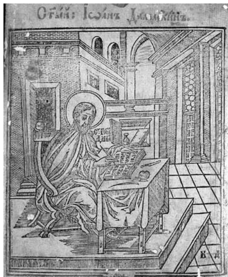
Św. Jan Damasceński, Oktoich , Kijów 1629, k. 2v

(na podstawie < http://old.stsl.ru/manuscripts/staroepchatnye-knigi/147 >)