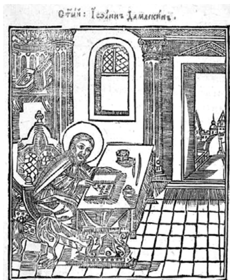
Św. Jan Damasceński, Oktoich , Kutein 1646, k. 2v, (na podstawie < http://old.stsl.ru/manuscripts /staroepochatnye-knigi/156 >)

również sprawowaną w metropolii kijowskiej liturgię, która według niego wyłoniła się z liturgii św. Jakuba apostoła, opracowanej i skróconej tylko przez Bazylego Wielkiego i Jana Chryzostoma: