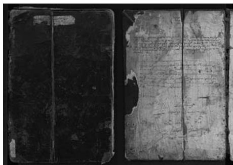
Обложка и оборот переплетной крышки Виленского сборника

отсутствуют) долгое время хранился в библиотеке Супрасльского Благовещенского монастыря, а потом – в Виленской публичной библиотеке, откуда и получил название Виленский список. Людмила Станкевич считает, что кодекс «датируется 60-ми годами XVI века по палеографическим признакам. Прямая дата написания в рукописи отсутствует» 3 . Нельзя не отметить, что такая датировка рукописи безусловна: pdf-копия памятника размещена в Интернете (< http://knihi.com/none/Aristotielevy_vrata,_ili_TajnaJa_tajnych_rukopis_bieloruskocho_pisma.html#1 >), и в пояснительной справке названа более ранняя дата – конец XV – начало XVI века. Ниже приведены аргументы в пользу более ранней даты создания памятника.