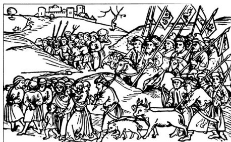
Erhard Schön, Die Verwüstungen durch die Türken, Blatt 1., 1532. London, British Museum

< https://upload.wikimedia.org/wikipedia/commons/4/41/Yasyr_3.jpg >