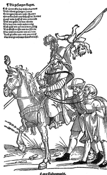
Die gefangen klagten, tekst H. Sachs, ryc. Erhard Schön, wyd. H. Guldenmundt, Norymberga, po 1530 < https://commons.wikimedia.org/wiki/Category:Yasyr#/media/File:Yasyr_1.jpg >

Mohyla, znając całą (trwającą zresztą do dziś) dyskusję wokół ważności sakramentów udzielanych poza prawosławiem, wyjaśnia (cz. 1, s. 191), dlaczego nie wolno powtarzać tych dwóch sakramentów, dodając do nich także trzeci niepowtarzalny sakrament – kapłaństwo. Zwraca uwagę na charakter, który wyciskają, że stanowią nieścieralne znamię . Chrzest bowiem wpisuje człowieka do Chrystusowych ksiąg życia wiecznego, wyciskając na duszy znak, po którym można rozpoznać chrześcijanina i odróżnić go od nieochrzczonego, jako znak przynależności do trzody Chrystusa. Bierzmowanie to akt wpisu do rejestru (katasteru) bojowników Bożych, zaś kapłaństwo naznacza duszę