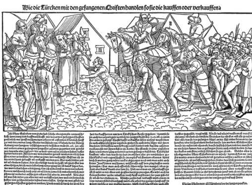
E. Schön, Chrześcijanie w tureckiej niewoli, po 1530 < https://commons.wikimedia.org/wiki/Category:Yasyr#/media/File:Yasyr_2.jpg >

Trzeci, co się wyrzekli wiary dobrowolnie bez żadnej konieczności (вольнымъ си произволеніємъ кромѣ всакоа нѣжды, cz. 1, s. 194) podlegają „strasznej anathemie” (страшное имѣть запрѣщениѣ, cz. 1, s. 194), ale przecież i ich obejmuje Boże miłosierdzie ; może ich zatem przywrócić prawosławiu dwuletni post od mięsa, sera, jaj i wina, ponadto codziennie młodszy mają wykonać 100 pokłonów i odmówić 200 modlitw Jezusowych, a słabi i chorzy – na ile im starczy sił. Po dwóch latach stosuje się przepisany rytuał. Tak referuje metropolita kanon pokutny Metodego. Warto zwrócić uwagę