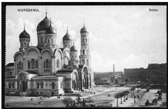
Il. 8. Sobór św. Aleksandra Newskiego na Placu Saskim w Warszawie (1894–1912), pocztówka sprzed 1916 roku, Biblioteka Narodowa, fot. Biblioteka Narodowa

Ikonografię Aleksandra Newskiego z tego okresu należy rozpatrywać w kontekście wyobrażeń świętych wojowników, choć ma ona równocześnie zdecydowanie imperialny charakter, akcentując książęcy strój Aleksandra – prezentuje go jako zwycięskiego wodza. Ikony św. Aleksandra Newskiego powstające w oficjalnej Cerkwi są zwykle dziełami mocno zaznaczonymi nowym językiem