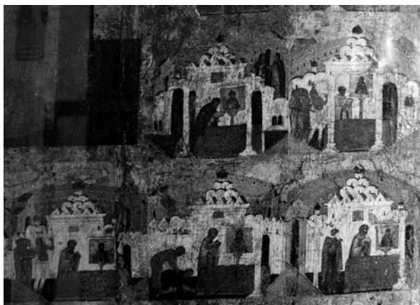
Il. 5. Ikona św. Aleksandra Newskiego ze scenami z żywota, Moskwa, XVII w. – fragment, cerkiew Wasyla Błogosławionego w Moskwie

podlennik Stroganowski i oparty na materiałach osiemnastowiecznych podlennik Filimowna 61 . Tylko w nowogrodzkim podlenniku z XVI wieku pojawia się wskazówka, żeby przedstawiać Aleksandra „tak jak Jerzego”, co wskazywałoby raczej na akcentowanie świeckiej, rycerskiej szaty i obrazu księcia jako zwycięskiego wojownika 62 . Równocześnie zabytki nie dowodzą znacznego rozpowszechnienia kultu św. Aleksandra przed XVII wiekiem. Do połowy XVI wieku wśród wizerunków świętego zdecydowanie