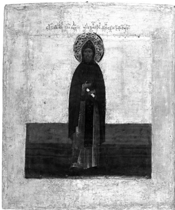
Il. 2. Ikona św. Aleksandra Newskiego, Moskwa, koniec XVI w., Klasztor Ipatiewski w Kostromie

nie chwile żywota Aleksandra sakralizują tę wcześniejszą ludzką historię dzielnego i zwycięskiego władcy.