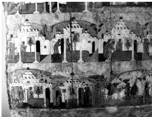
Il. 4. Ikona św. Aleksandra Newskiego ze scenami z żywota, Moskwa, XVII w. – fragment, cerkiew Wasyla Błogosławionego w Moskwie, fot. Aleksandra Sulikowska-Belczowska

wionego w Moskwie [il. 3–5]. W centrum ikony ukazany został Aleksander w monastycznym odzieniu, stojący i podnoszący dłoń w geście błogosławieństwa. Jego postać otoczona jest 32 klejmami ilustrującymi żywot oraz liczne cuda pośmiertne 58 . Jest to ikona szczególna, prezentująca Aleksandra, podobnie jak poprzednie, jako świętego mnicha, jednak różniąca się od nich wymiarami, rozmachem, a także wyobrażeniami scen hagiograficznych. Aż w szesnastu klejmach można zobaczyć jego ikonę, przed którą wierni modlą się bądź doznają uzdrowień [il. 4–5], choć o obecności takiego wizerunku świętego nie wspomina datowana na 1591 rok redakcja żywota Aleksandra Newskiego, do której obraz z cerkwi Wasyla Błogosławionego zdaje się odnosić 59 . Obecność tych wizerunków wskazywać jednak może, że właśnie taka ikona – popiersiowy wizerunek księcia jako mnicha – znajdowała się nad jego grobem we Włodzimierzu.