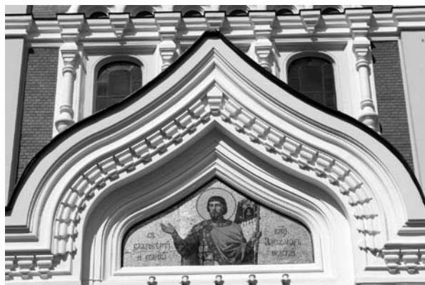
Il. 7. Wizerunek św. Aleksandra Newskiego nad południowym wejściem do soboru w Tallinie

Newskiego w szacie książęcej 88 , który może być traktowany jako nowy wzorzec ikonografii świętego 89 .