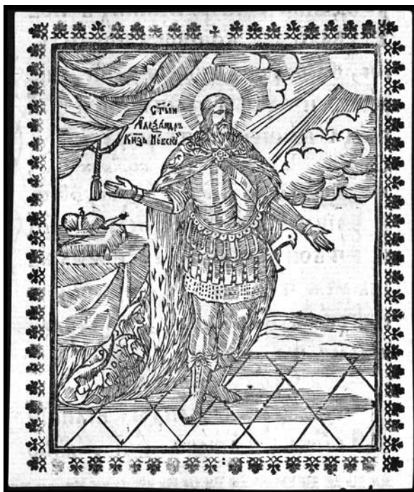
Il. 10. Św. Aleksander Newski, drzeworyt, Rosja, XVIII w., Biblioteka Narodowa

Jednak również w malarstwie Palechu – niekoniecznie starowierskim – takie wizerunki Aleksandra mogły się pojawiać, stanowiąc nie tyle w pełni świadome odstępstwo od zaleceń Świętego Synodu, co raczej powtórzenie dawnych wzorów, znanych malarzom z istniejących w Palechu podlinników 107 . Niekiedy zresztą przedstawienia Aleksandra jako mnicha wpisują się w programy ikonograficzne wyobrażeń pochodzących z oficjalnej Cerkwi. Tak jest w przypadku ikon hagiograficznych. Mogą one wyobrażać Aleksandra jako księcia, ale w klejmach ze scenami poprzedzającymi śmierć i z momentem śmierci – ukazuje się go w szacie mnicha 108 . W ten sposób również wyobrażany jest na niektórych menologionach 109 , np. Muzeum Narodowe w Warszawie posiada ikonę bez większych wątpliwości pochodzącą z warsztatu pracującego dla oficjalnej Cerkwi, gdzie