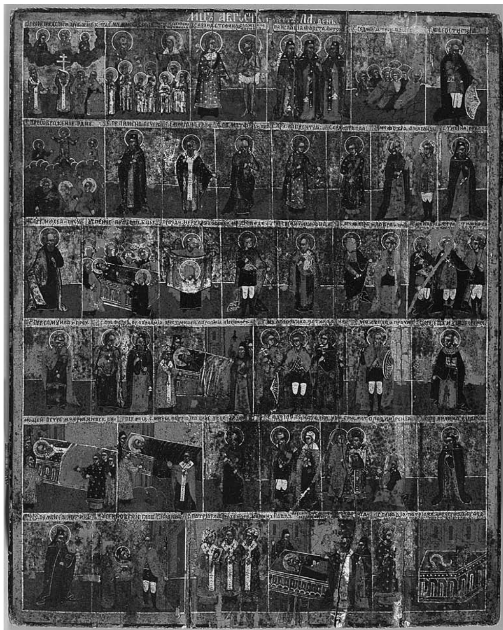
Il. 11. Ikona kalendarzowa: Sierpień – stan przed konserwacją, Rosja, XIX/XX wiek, Muzeum Narodowe w Warszawie