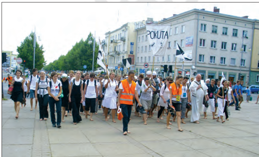
Fot. 3. Uczestnicy XXII Pieszej Pielgrzymki Dominikańskiej z grupy Pokuta pielgrzymujący na Jasną Górę Aleją NMP w Częstochowie (09.08.2013,)

pozycję (ryc. 2). W 2011 r. powołano do życia grupę Rodzinną , dla osób, które pragną przemierzać trasę całymi rodzinami z dorosłymi lub małymi dziećmi. W 2012 r. pielgrzymkę tworzyły następujące grupy: Dziewiętnastka , grupy duszpasterstwa akademickiego: B1 , B2 , cieszące się dużą popularnością: Cisza 1 i Cisza 2 , wspomniana grupa Rodzinną oraz nowopowstałe grupy Żaki (jako kontynuacja grupy Międzymiastowej GPS ) i grupa Pokutna (www 1; www 9; por. www 7) (fot. 3). Ostatnią zmianą wprowadzoną w 2013 r. jest zgromadzenie członków dominikańskich duszpasterstw akademickich, pochodzących z kilku miast Polski w grupie B3 , która istniała jeszcze w 2011 r. Trzecia grupa „Beczki” zajęła miejsce wspomnianej wspólnoty – Żaki 34 .