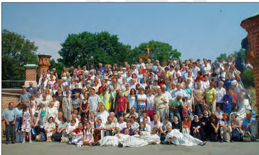
Fot. 1. Uczestnicy XXX Pieszego Pielgrzymstwa Skalecznego na Jasnej Górze (21.07.2006,)