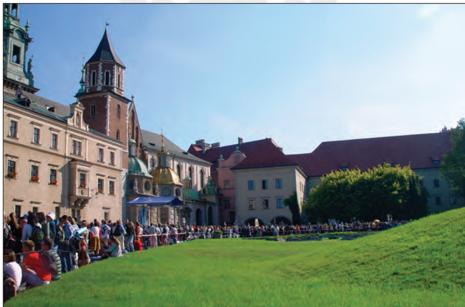
Fot. 2. Uczestnicy XXVIII Pieszej Pielgrzymki Krakowskiej zgromadzeni na Wawelu na mszy świętej inaugurującej pielgrzymowanie (06.08.2008,)

Sytuacja społeczno-polityczna, w jakiej kształtowała się ta pielgrzymka, bez wątplenia zdeterminowała jej charakter. W kilka lat liczba jej uczestników znacznie wzrosła, z pięciu grup skupiających niecałe 2 tys. pielgrzymów do wielotysięcznej i wielonarodowościowej pielgrzymki, złożonej z ośmiu wspólnot. W 2012 r. liczba