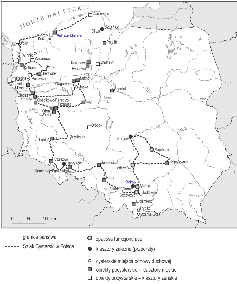
Ryc. 1. Obiekty cysterskie i pocysterskie w Polsce