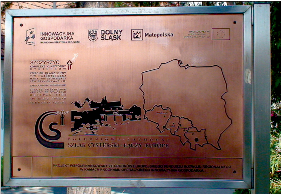
Fot. 2. Oznakowanie szlaku cysterskiego