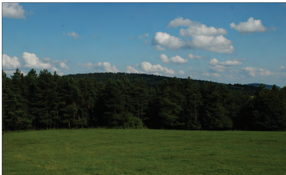
Fot. 2. Wyszowatka. Granica statyczna Photo 2. The static forest-field boundary at Wyszowatka