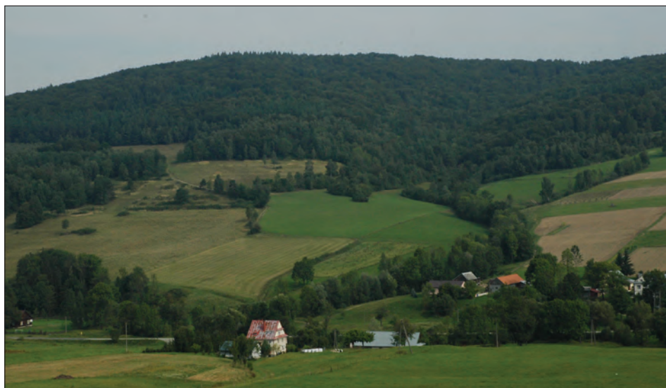
Fot. 1. Owczary. Wkraczanie roślinności leśnej wzdłuż rozcięć erozyjnych Photo 1. Expansion of forest along erosional forms at Owczary