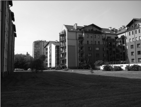
Fot. 3. Zieleni o funkcji głównie estetycznej, os. Żabiniec, Kraków Photo. 3. Esthetic function of green areas, Żabiniec housing estate, Kraków