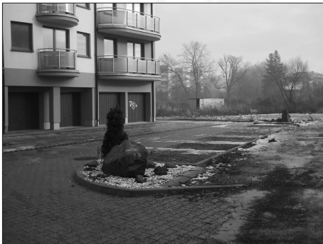
Fot. 5. Aranżacja zieleni – tuja i kamień, zabudowa wielorodzinna, Ruczaj, ul. Drukarska, Kraków Photo. 5. Green „composition” – shrub/tree and stone, housing estate, Ruczaj, Kraków