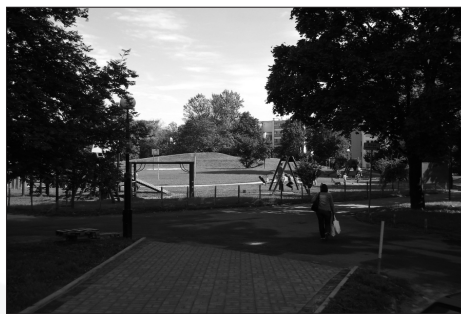
Fot. 8. Zielona przestrzeń rekreacyjna w os. Słowackiego, LSM, Lublin

Photo. 7. Piastowskie housing estate – small park, LSM, Lublin