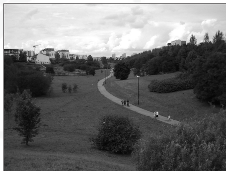
Fot. 2. Park Rury, wtopiony w zabudowę wielorodzinna dzielnic LSM i Rury, Lublin Photo. 2. Rury Park between housing estates of LSM and Rury, Lublin