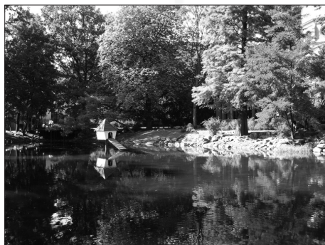
Fot. 1. Zielen i woda. Park im. Kazimierza Wielkiego, Bydgoszcz Photo. 1. Green and water. Kazimierz Wielki Park, Bydgoszcz

Dla zobrazowania jakości tej zieleni, zwłaszcza tzw. zieleni osiedlowej, przytoczono kilka przykładów z polskich miast. W odniesieniu do współczesnych trendów w kształtowaniu zabudowy mieszkaniowej wielorodzinnej za ilustrację mogą posłużyć