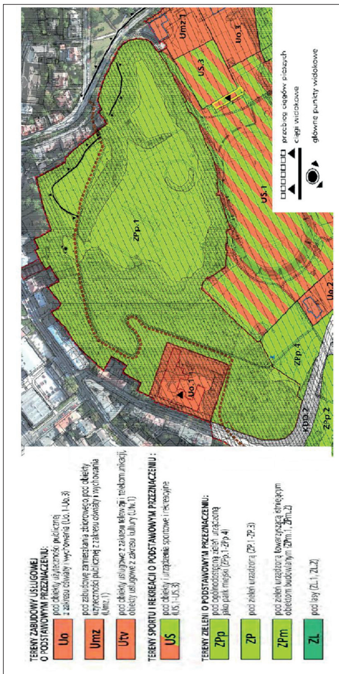
Ryc. 1. Fragment planu miejscowego Stare Podgórze-Krzemionki w Krakowie – teren ZPp.1 – Park Bednarskiego Fig. 1. Part of Stare Podgórze-Krzemionki local plan in Krakow, ZPp.1 zone, Bednarski Park