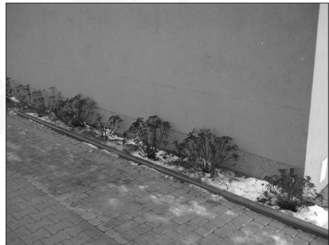
Fot. 6. Rachityczna zieleni – przy ścianie budynku – zabudowa przy ul. Drukarskiej, Ruczaj, Kraków Photo. 6. Shrubs alongside building wall – block of flats next Drukarska Street, Ruczaj, Kraków