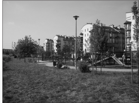
Fot. 4. Zieleni z urządzeniami do zabaw dla dzieci na obrzeżu os. Żabiniec, Kraków Photo. 4. Park with place for children, on the border of Żabiniec housing estate, Kraków