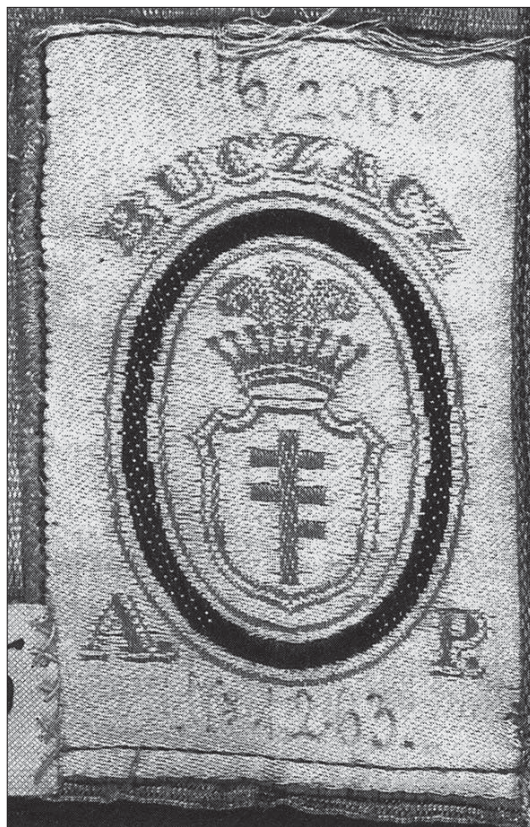
Il. 4. Metryczka buc Zackiej tkalni Artura Potockiego, z makaty w zbiorach Muzeum Narodowego w Warszawie, fot. wg: J. Chruszczyńska, Makaty buc Zackie w zbiorach Muzeum Narodowego w Warszawie , Warszawa 1996, s. 10