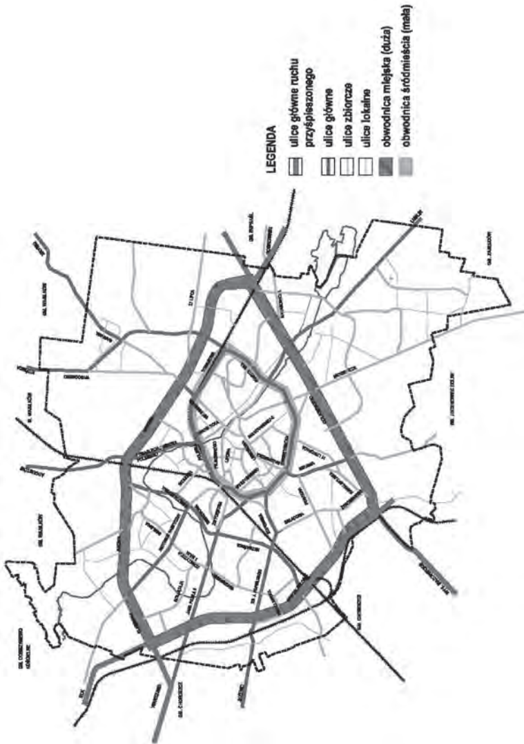
Rysunek 2. Docelowa sieć dróg w Białymstoku

Figure 2. Planned road infrastructure in Białystok