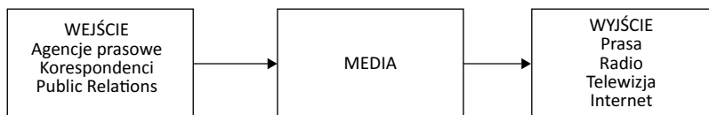
Rys. 1. Proces konwersji wiadomości w mediach