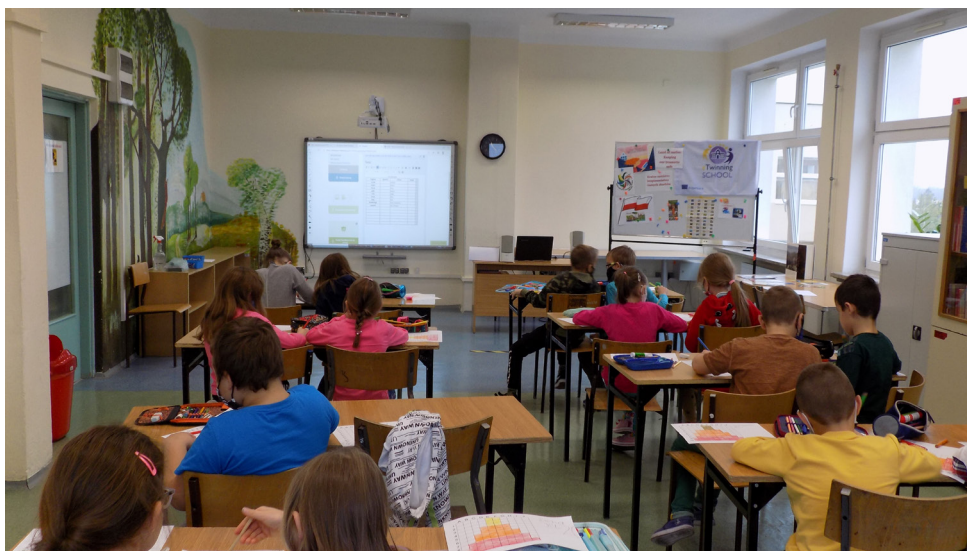
II. 2. Zajęcia klasy 2C w projekcie eTwinning.

za tym idzie uruchomienie modułu rezerwacji w programie bibliotecznym Mol net+, a w dalszej kolejności stworzenie możliwości zamawiania książek drogą mailową i telefoniczną. Nauczyciele bibliotekarze dbali również o zbiory biblioteczne, w tym szczególnie podręczniki szkolne, bezpieczne ich korzystanie i powrót do biblioteki.