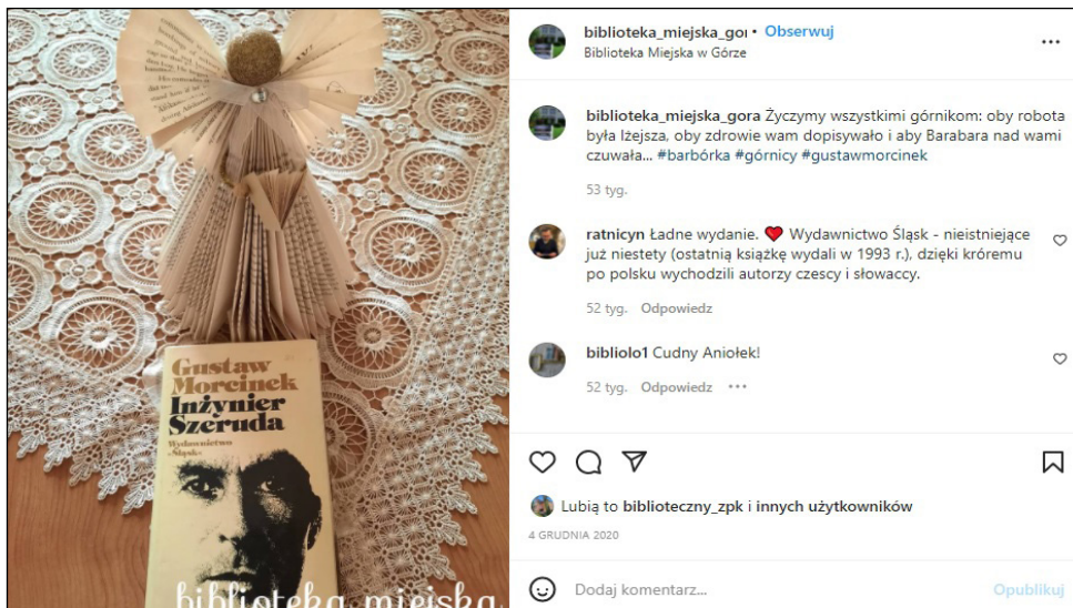
II. 3. Post z fotografią okładki książki Inżynier Szeruda . Źródło: zrzut ekranu z Instagrama. Post instytucjonalny Biblioteki Miejskiej w Górze, dostępny publicznie (Biblioteka Miejska w Górze, 2020).

nictwo LTW w roku 2010 oraz zbiór Baśnie śląskie Oficyny Wydawniczej Rytm również z 2010 roku. Zdarza się, że wśród zdjęć okładek prezentowane są tytuły przedwojenne, takie jak: Ludzie są dobrzy (Biblioteka Polska, 1939), wspomniana już wcześniej monografia Śląsk (Wydawnictwo Polskie R. Wegnera, 1933). Wśród ciekawszych postów znajdują się fotografie dwóch obwolut. Pierwsza prezentuje Pokład Joanny (Śląsk, 1956), druga obwolutę zaprojektowaną przez Wiktora Ostrzołka do wydania z oficyny Śląsk z 1956 roku, obejmującego tytuły: Narodziny serca , Ludzie są dobrzy , Gwiazdy w studni . W przypadku postów związanych ze śląskim pisarzem i prezentujących książki nie pojawiają się jakiegokolwiek nawiązania do świata mediów społecznościowych i nowoczesnych technologii. Inaczej wygląda to, gdy przeanalizuje się posty dotyczące autorów współczesnych, na przykład Remigiusza Mroza (Ratajczak, 2021). Wśród sześciu najpopularniejszych postów z hasztagiem #remigiuszmróz pojawia się zdjęcie czytnika e-booków prezentującego okładkę powieści. W postach związanych z Gustawem Morcinkiem brak również często używanych na Instagramie memów. Podsumowując, dodać trzeba informację, że w przeważającej części posty prezentujące książki publikowane są z kont prywatnych, choć zdarzają się wyjątki, które omówione zostały w dalszej części pracy.