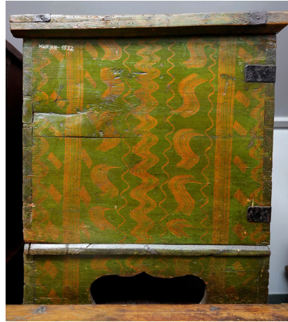
Ryc. 2. Skrzyżowane linie faliste na skrzyni MWR/KM 1780