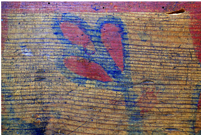
Ryc. 8. Stylizowany kwiat o trzech płatkach MWR/KM 5142 Fot. S. Klochowicz, 2022 rok