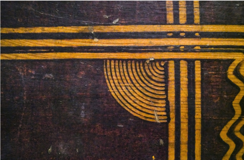
Ryc. 3. Wzór ćwierćkoła ze skrzyni MWR/KM 1780

Kolejnym wzorem spotykanym na skrzyniach są ćwierćkola występujące w rogach obramowań oraz wiatraczki i kółka, które znajdują się najczęściej pośrodku pola zdobniczego lub symetrycznie rozmieszczone między krzyżującymi się liniami. Ostatnim motywem zdobniczym znajdującym się tylko na jednej skrzyni jest drobna kratka. Skrzynia ta została pozyskana we wsi Jastrzębia (gm. Jastrzębia, pow. radomski).