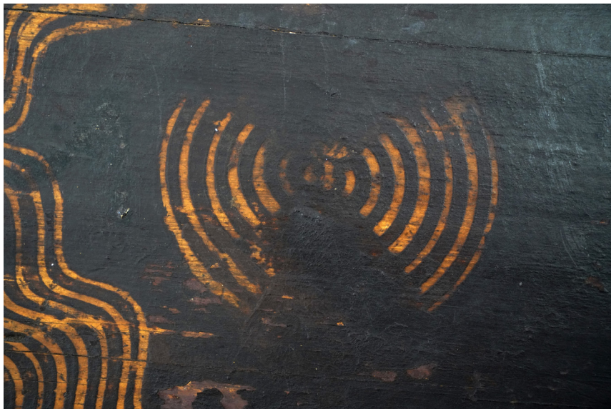
Ryc. 4. Przykładowy wzór wiatraczka ze skrzyni MWR/KM 8403 Fot. S. Klochowicz, 2022 rok