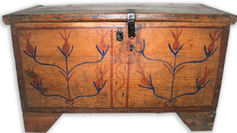
Ryc. 14. Skrzynia MWR/KM 7022 Fot. K. Kozyra, 2022 rok