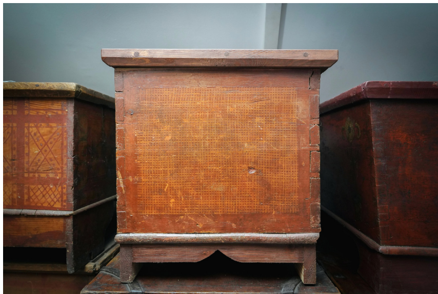
Ryc. 6. Wzór drobnej kratki wypełniającej całe pola zdobnicze na skrzyni MWR/KM 72/3376