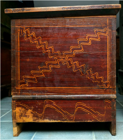
Ryc. 1. Linie faliste na skrzyni MWR/KM 1532