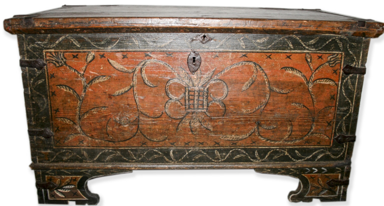
Ryc. 12. Odosobniony przykład wzornictwa regionu radomskiego na skrzyni MWR/KM 4742

Ostatnia z omawianych skrzyń ma całkiem odmienny styl. Charakteryzuje ją układ jednopolowy utworzony przez czarną szeroką ramkę z cienkimi białymi obwódkami po zewnętrznych stronach i białym falującym ornamentem łodygi z liśćmi ułożonymi naprzemiennie, wypełniającymi całą szerokość bordiury. Wewnątrz pole ma tło koloru jasnego brązu, na którym umieszczony jest czarno-biały ornament florystyczny. Centralnie znajduje się mały czarny prostokąt wypełniony kratką, od którego symetrycznie rozchodzą się dwie długie czarne łodygi na końcach zwieńczone kwiatem i pąkiem. Łodygi mają wąskie białe liście z czarną obwódką tylko z jednej strony. Od tej obwódki poprowadzone są krótkie czarne równoległe linie nadające cień liściom. Ornament wypełnia całe pole, a przy zewnętrznej jego części znajdują się małe czarne „iksy”. Taki układ dekoracji malarskiej spotykany jest między innymi w opoczyńskim 19 .