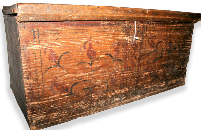
Ryc. 15. Skrzynia MWR/KM 5633