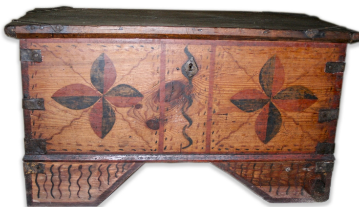
Ryc. 9. Rozeta na skrzyni MWR/KM 30/904