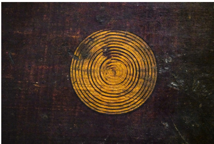
Ryc. 5. Mazerowane kółko ze skrzyni MWR/KM 424/4346 Fot. S. Klochowicz, 2022 rok