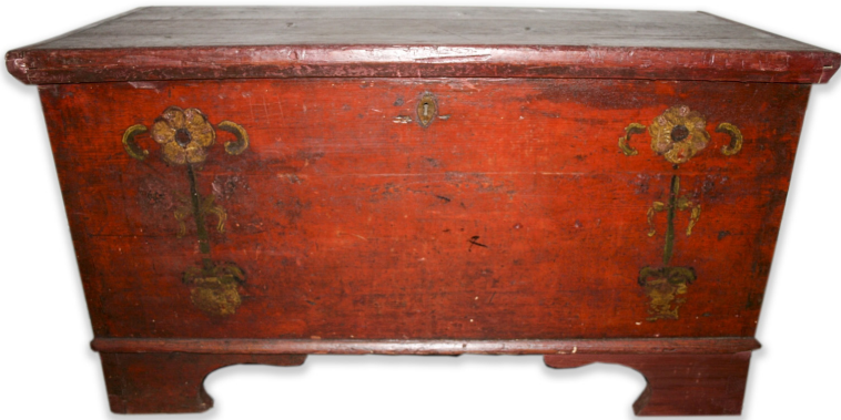
Ryc. 11. Żółte kwiaty namalowane na skrzyni MWR/KM 7226

Jedna skrzynia nie ma wyraźnie wyodrębnionych pól (dlatego nie została zaliczona do tego podziału), ale ma symetrycznie ułożony wzór sugerujący podział na dwie części. Jest to żółty kwiat o sześciu płatkach na zielono-czarnej łodydze stojący prawdopodobnie w doniczce koloru żółtego. Przy bliższych oględzinach po bokach łodygi (poniżej głównego kwiatu) można dopatrzeć się śladów po mniejszych białych kwiatkach.