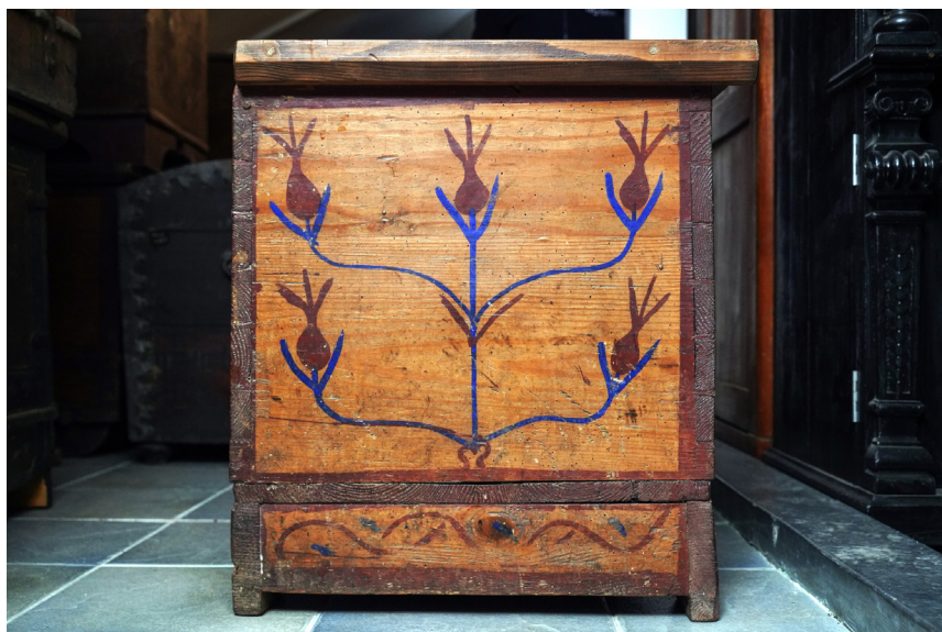
Ryc. 7. Przykład pąka MWR/KM 7022

Najczęściej występującym podziałem ornamentacyjnym jest rozmieszczanie elementów zdobniczych w dwóch polach – aż 16 z 18 skrzyń ma taki układ. Kształt pól to kwadraty (podział popularny m.in. w woj. radomskim 17 ) lub kwadraty z ramką (taki układ jest bardzo powszechny 18 ) wyznaczone przez proste linie w kolorze czerwonym. Ornament występuje przede wszystkim w kolorze czerwono-granatowym (prawie czarnym) przedstawiającym motyw roślinny. W pięciu przypadkach jest to kwiat widziany z boku, mający w głównej mierze trzy płatki w kształcie łezki wychodzące z jednego punktu, w czterech przypadkach jest to stylizowany kwiat tulipana lub nierozwiniętego pąka.