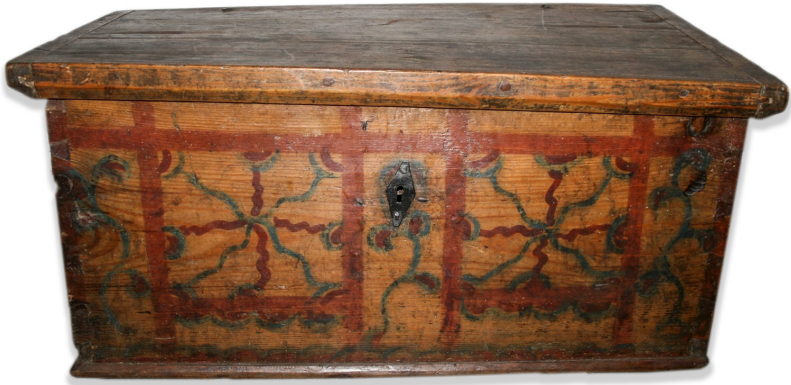
Ryc. 10. Skrzynia MWR/KM 607/4612