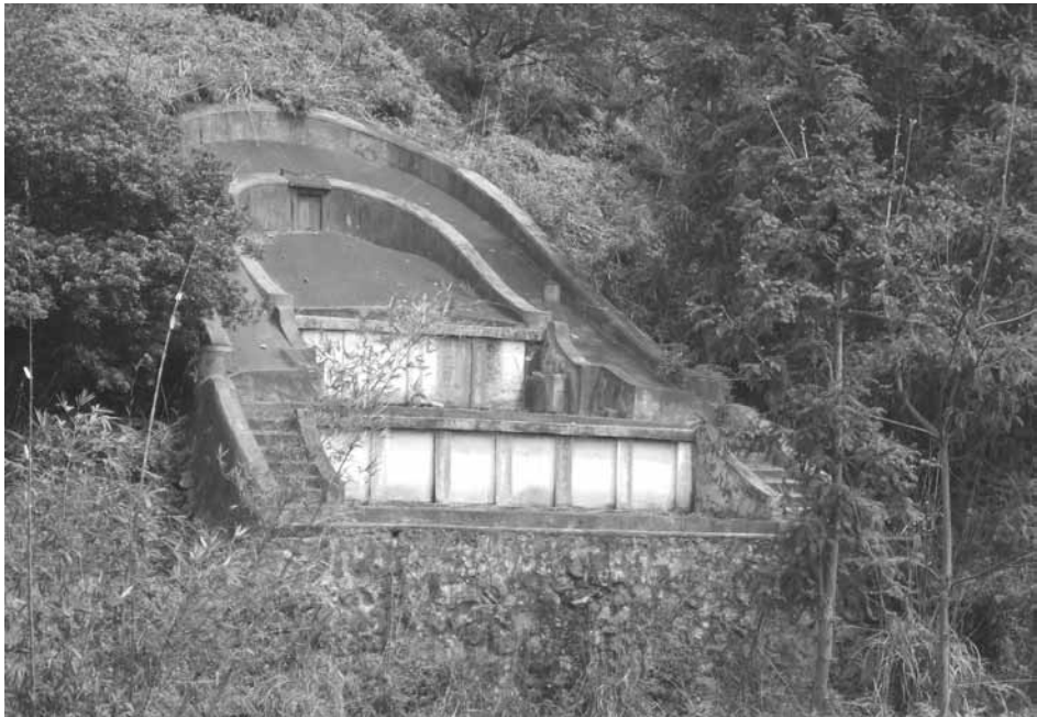
Ryc. 2. Stary nagrobek typu 椅子墳 (w kształcie fotela)