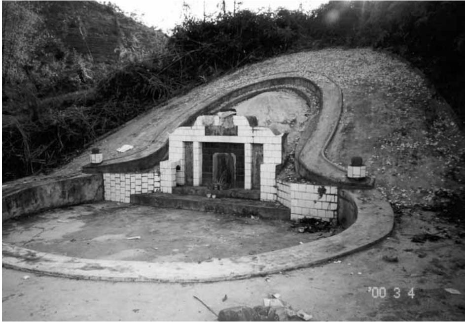
Ryc. 5. Duży nagrobek w kształcie skorupy żółwia