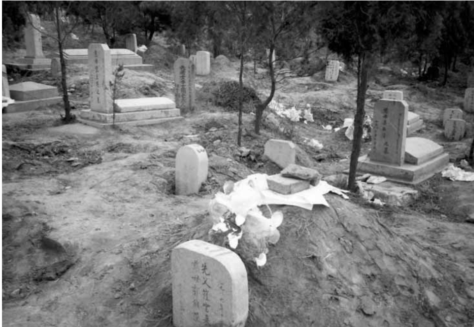
Ryc. 1. Tradycyjny nagrobek, kopiec ziemi w kształcie pyzy, fot. He Bin