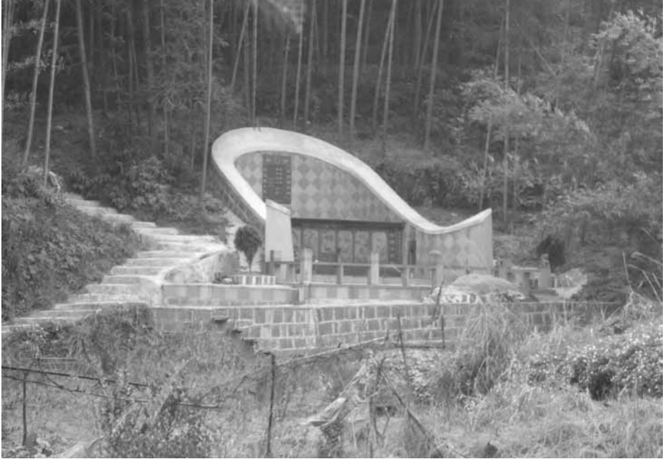
Ryc. 3. Nowy nagrobek typu 椅子墳 (w kształcie fotela), fot. He Bin