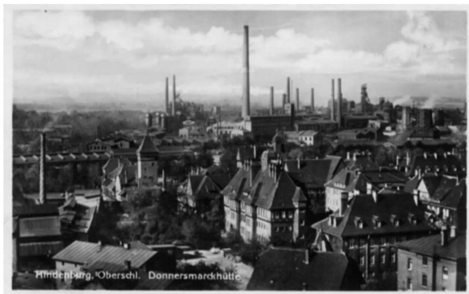
Fot. 1. Osiedle Zandka na tle huty na starej pocztówce

W niniejszym artykule pojęcie tradycji pojmowane jest, podobnie jak w ostatnim prezentowanym ujęciu, jako dziedzictwo kulturowe badanego obszaru. Próbę skonfrontowania tradycji i współczesności w zabytkowej jednostce urbanistycznej podjęto na przykładzie osiedla Zandka w Zabrze 14 .