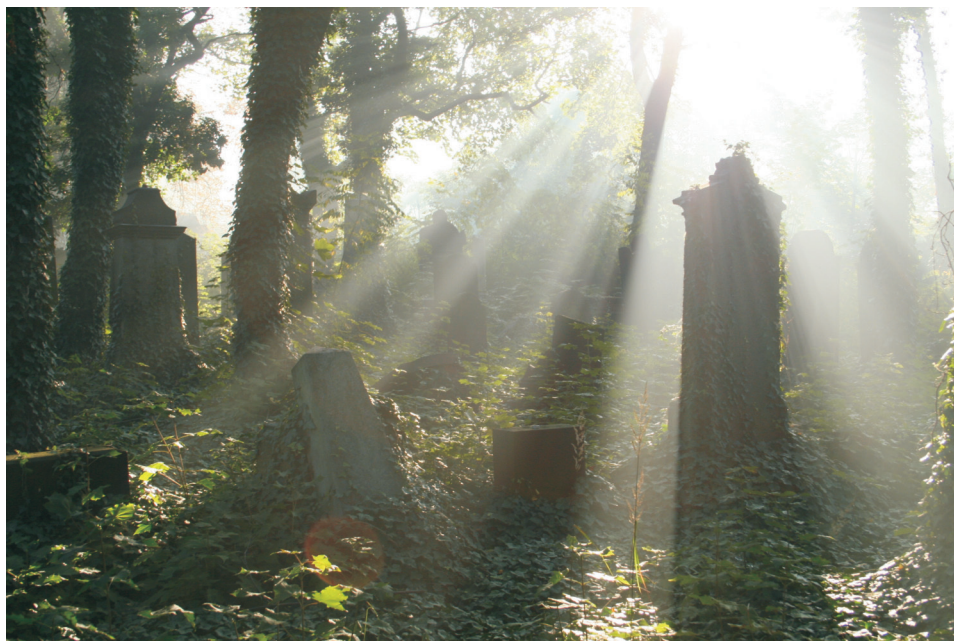
Fot. 2. Cmentarz żydowski

stacji cmentarza żydowskiego. Obecnie nekropolia ta jest traktowana jako cenny zabytek i dlatego często bywa odwiedzana przez turystów.