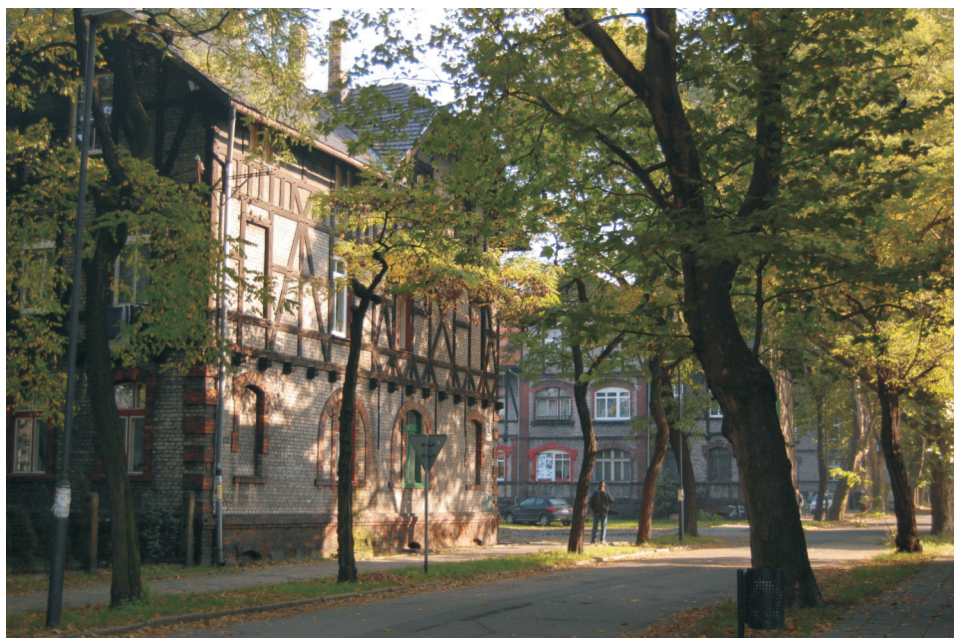
Fot. 3. Osiedle Zandka współcześnie

Zandki wobec historycznych obiektów osiedla. Dziedzictwo kulturowe w zmodernizowanej rzeczywistości postrzegane jest przez badaną społeczność jako narzędzie do osiągnięcia realnych korzyści, czyli odrestaurowania zniszczonej kamienicy lub uporządkowania terenu albo po prostu pozbycia się wstydu, że mieszka się w negatywnie naznaczonej przestrzeni. Wydaje się również, że tradycja oprócz poszukiwania własnej tożsamości – jak to sugerował A. Giddens – służy także innym celom. Współcześni mieszkańcy odwołują się do przeszłości nie z powodów sentymentalnych ani nie w celu poszukiwania sprawdzonych schematów życia. Próbuje zaspokoić najbardziej elementarną potrzebę mieszkania w bezpiecznym i zdrowym otoczeniu, co było do niedawna trudne w środowisku Zandki. Dopiero po zaspokojeniu tej potrzeby dziedzictwo kulturowe może stać się w tym miejscu podstawą kształtowania lokalnej tożsamości.