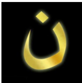
Grafika 2. Arabska litera nun w kampanii internetowej

W mediach społecznościach zrodziła się kampania, w ramach której przekazywana była arabska litera nun . Użytkownicy zmieniali nawet całe awatary na ten symbol. Działalność ta miała być ich oporem przeciw prześladowaniom chrześcijan w Iraku. W miejscowości Mosul dżihadyści pisali ten symbol na drzwiach chrześcijańskich rodzin. Nun jako 14. znak alfabetu arabskiego nawiązywał do Nazarejczyków, czyli chrześcijan tak nazywanych przez islamistów. W mediach społecznościowych użytkownicy dzielili się tym hashtagiem niezależnie od własnego wyznania.