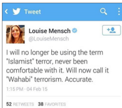
Grafika1. Wpis na Tweeterze dotyczący terminu „islamski”

Wśród globalnych hashtagów skupiających internautów wokół konkretnych problemów powstał między innymi grupujący doniesienia dotyczące zbrodni dokonywanych w Iraku oraz Syrii przez tzw. Państwo Islamskie, skrócony do #ISIS. Gdy pojawiały się doniesienia dotyczące nowego ataku na osobę lub grupę ludzi w tamtej części świata, w social media wybuchała dyskusja. Powstały również alternatywne hashtagi, przez które użytkownicy chcieli przekonać, że założenie islamskiej religii jest przeciwieństwem działalności terrorystycznej. W ich rozumieniu używanie terminu „islamski” może być mylące.